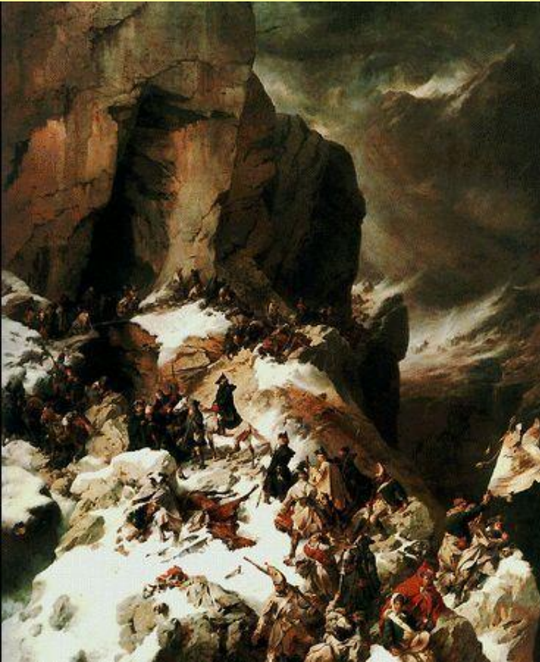
Переход Суворова через перевал Паникс в Альпах. Худ. А.Е. Коцебу.

К моменту прибытия Суворова корпус Римского-Корсакова был разгромлен французскими войсками генерала А. Массена.