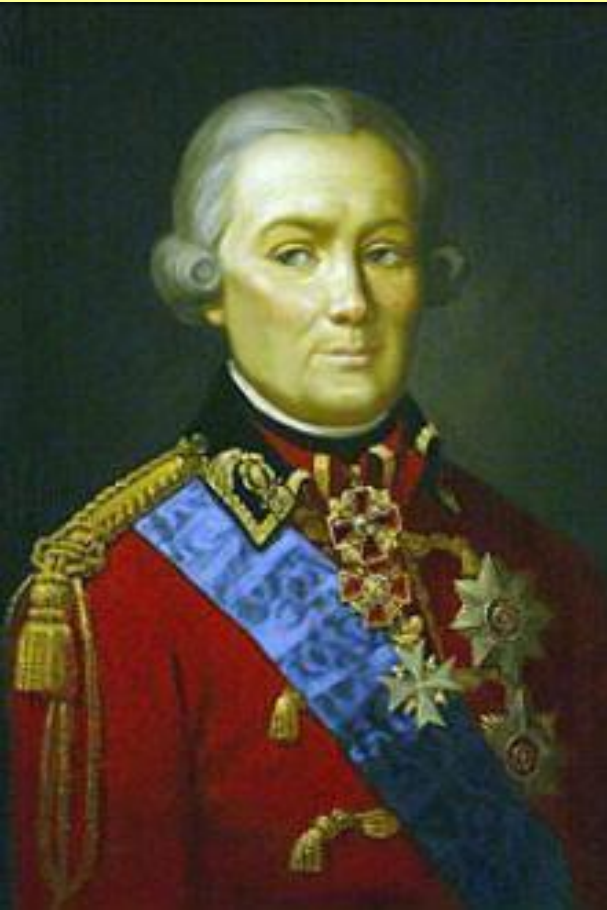
Граф П.А. Пален.

Недовольство внешней политикой Павла лишь усилило раздражение дворянства, и без того считавшего царя самодуром, если не душевнобольным.