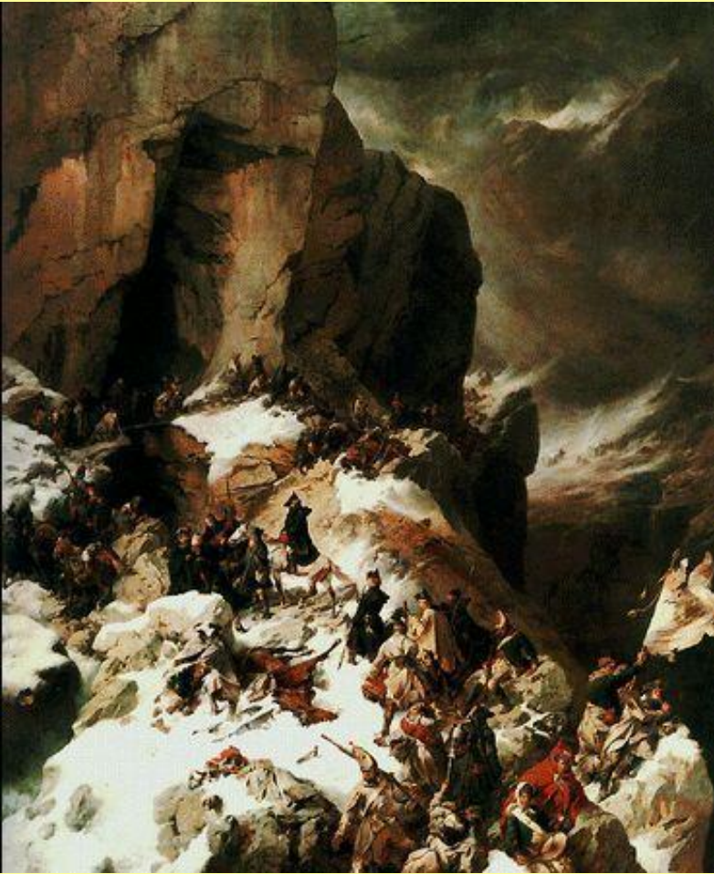
Переход Суворова через перевал Паникс в Альпах. Худ. А.Е. Коцебу.

К моменту прибытия Суворова корпус Римского-Корсакова был разгромлен французскими войсками генерала А. Массена.