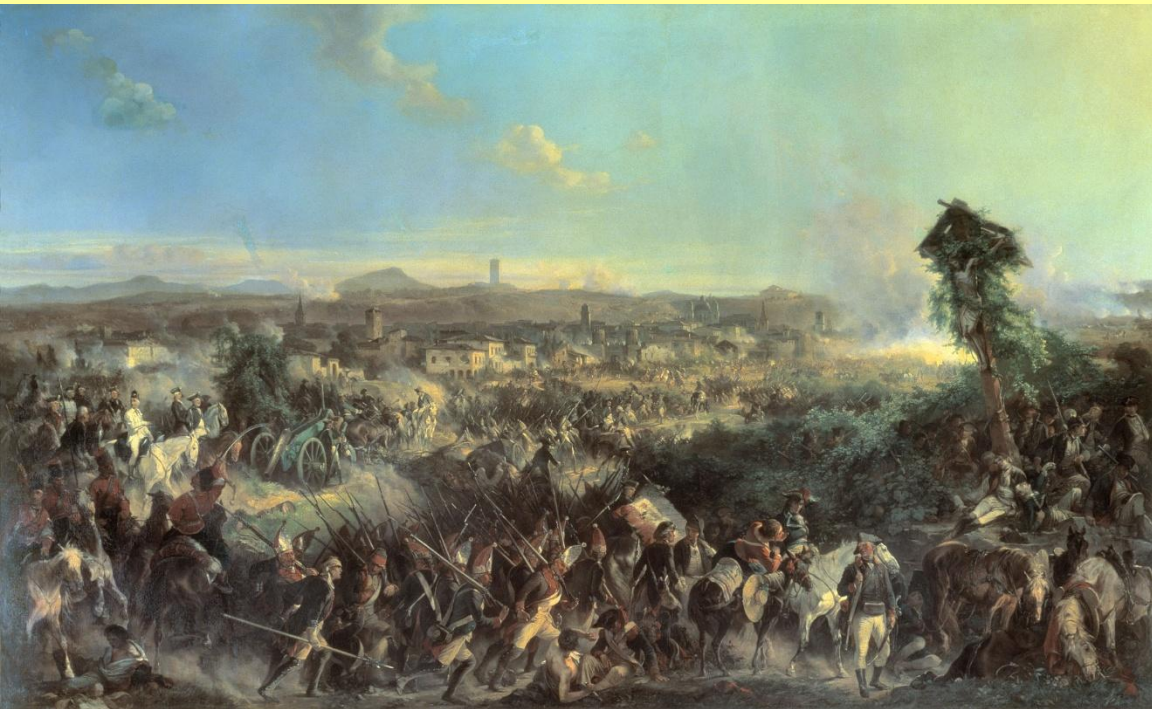
Битва при Нови. Худ. А. Коцебу.

15 августа Суворов разгромил французов при Нови.