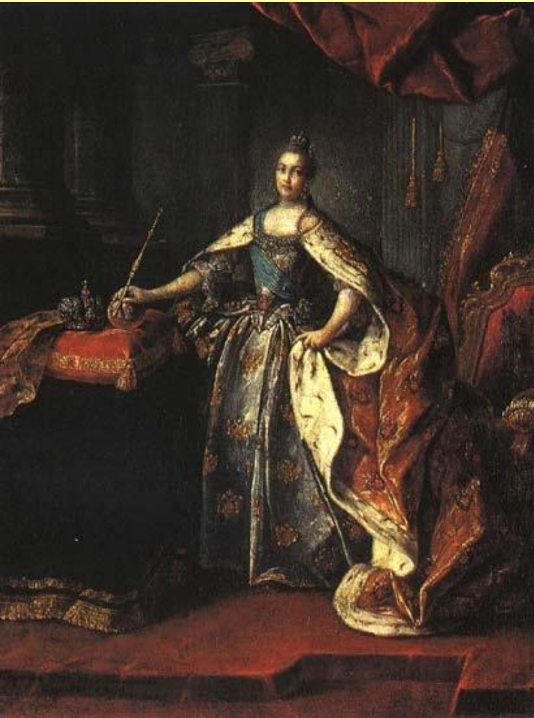
Екатерина II Алексеевна. Худ. А.П. Антропов. 1762 г.

Свергнув Петра III, Екатерина не пожелала стать регентшей при малолетнем сыне Павле, а сама вошла на престол.