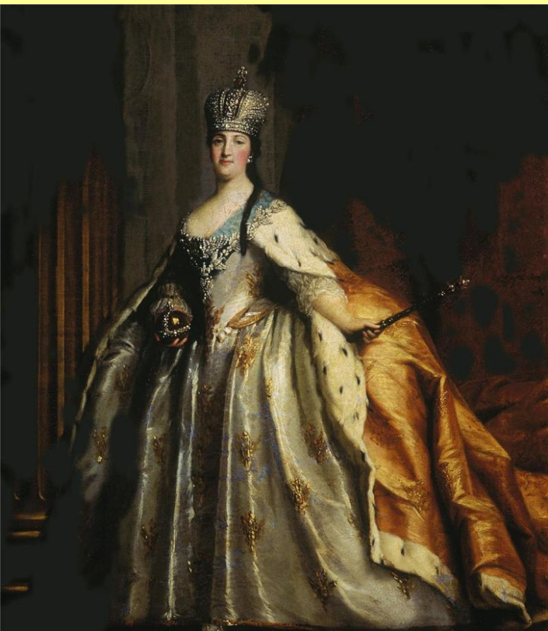
Портрет Екатерины II. Худ. Ст. Торелли.