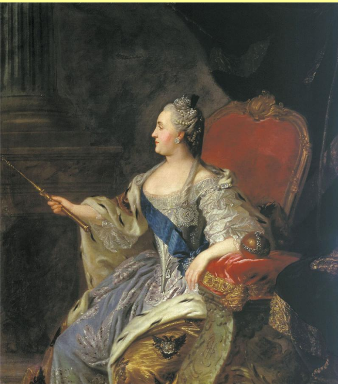
Портрет Екатерины II. Худ. Ф.С. Рокотов. 1767 г.

Екатерина II, по-видимому, считала, что без законодательного смягчения крепостного права и без провозглашения сословных прав (не привилегий!) остального населения новое Уложение окажется бесполезным, а то и вредным.