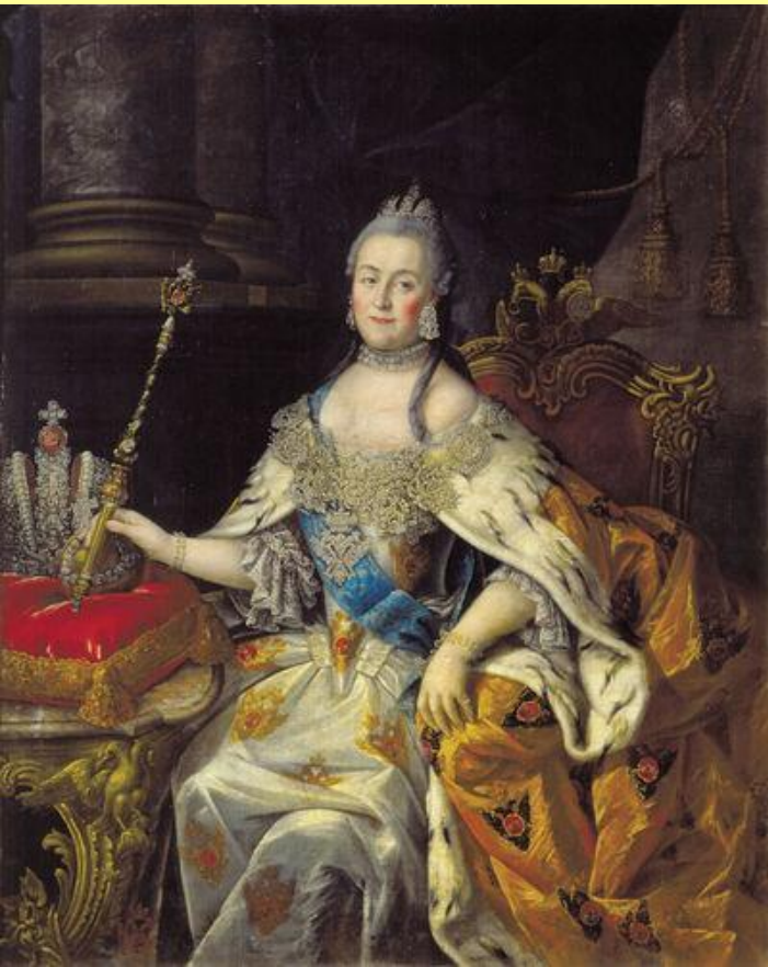
Портрет Екатерины II. Худ. А.П. Антропов. 1766 г.

Екатерина вела постоянную переписку с французскими философами: Вольтером, Дидро, д'Аламбером. Вдохновленная их учением, она взялась за решение грандиозной задачи, которую не сумели решить ни Петр, ни Елизавета: составление нового Уложения.