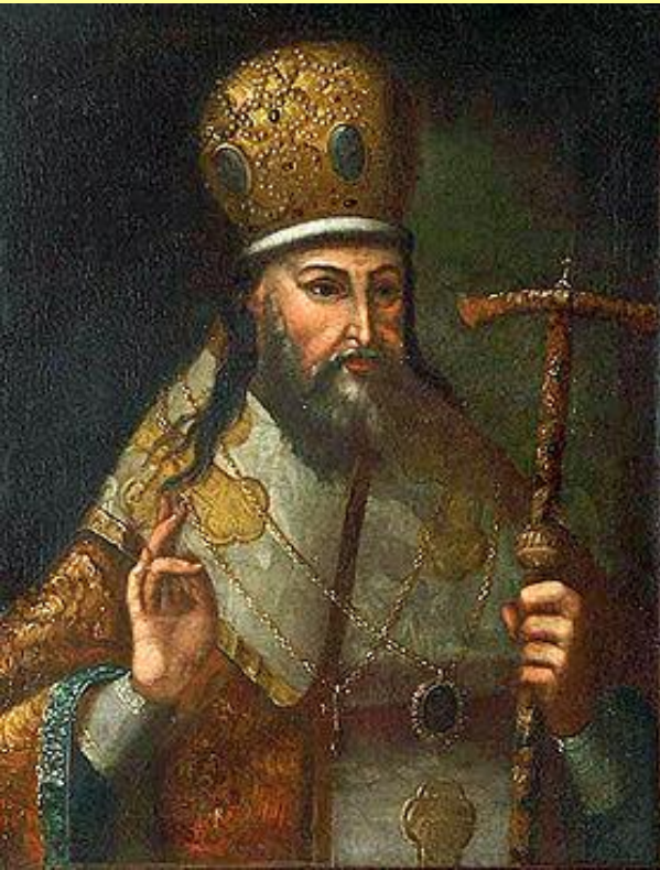
Митрополит Арсений (Марзеевич). Единственный архиерей, выступивший против секуляризации.

Вступив на престол, Екатерина отменила провозглашенную Петром III секуляризацию.