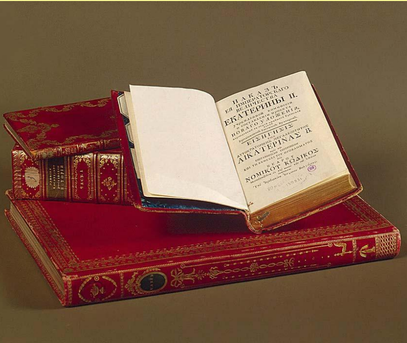
Книги из библиотеки Екатерины II. Собрание Гос. Эрмитажа.

«Для введения лучших законов необходимо потребно умы людские к тому приуготовить». «Государь есть самодержавный, ибо никакая другая, как только соединенная в его особе власть, не может действовать сходно с пространством толь великого государства».