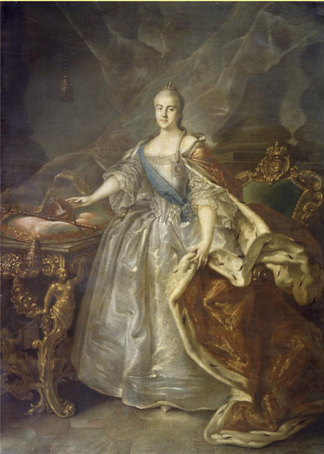
Портрет Екатерины II. Худ. И.П. Аргунов.