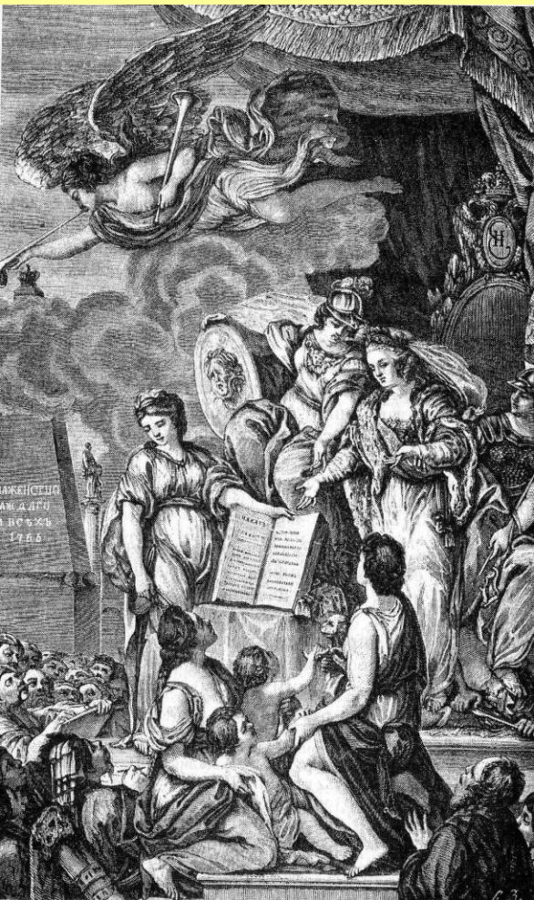
Аллегория на издание «Наказа» Екатерины II.

«Приложить должно более старания к тому, чтобы вселить узаконениями добрые нравы в граждан, нежели привести дух их в уныние казнями».