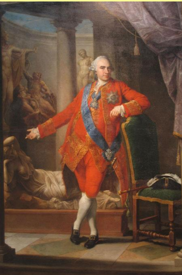
Портрет Кирилла Григорьевича Разумовского. Худ. Г.П. Батони. 1766 г.

В 1764 г. Екатерина приняла отставку последнего гетмана Украины К.Г. Разумовского.