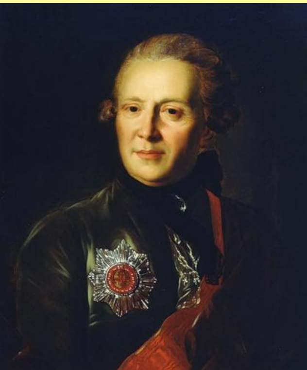
А.П. Сумароков, поэт и драматург. Худ. Ф.С. Рокотов.

О том же говорят и возражения А.П. Сумарокова на «Наказ»: «Сделать русских крепостных людей вольными нельзя... Будет ужасное несогласие между помещиков и крестьян, непрестанная будет в государстве междоусобная брань, вместо того, что ныне помещики живут покойно в вотчинах, отчины их превратятся в опаснейшие им жилища, ибо они будут зависеть от крестьян, а не крестьяне от них».