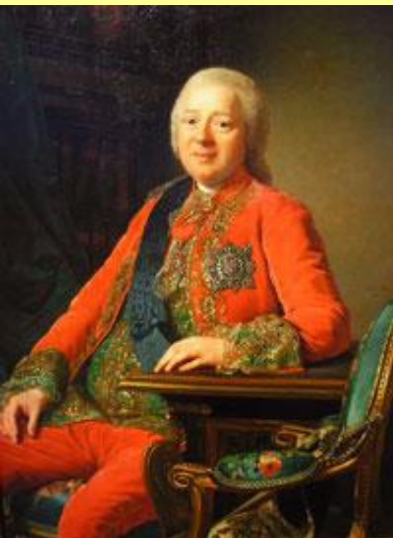
Никита Иванович Панин. Худ. А. Рослин.

Панин подал проект создания Императорского совета из 7–8 сановников, облеченных доверием монарха, который и должен был управлять страной.