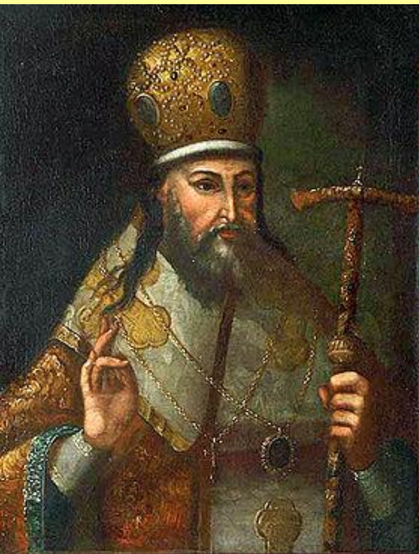
Митрополит Арсений (Марзеевич). Единственный архиерей, выступивший против секуляризации.

Вступив на престол, Екатерина отменила провозглашенную Петром III секуляризацию.