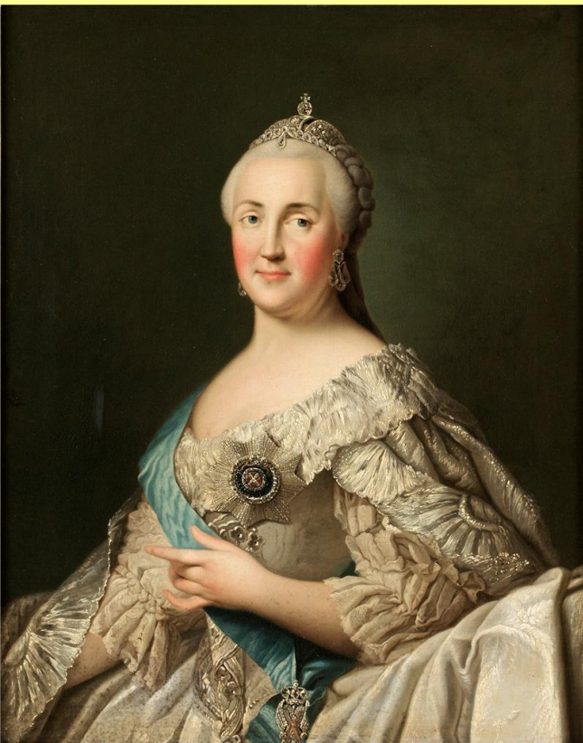
Екатерина Великая. Худ. В. Эриксен.