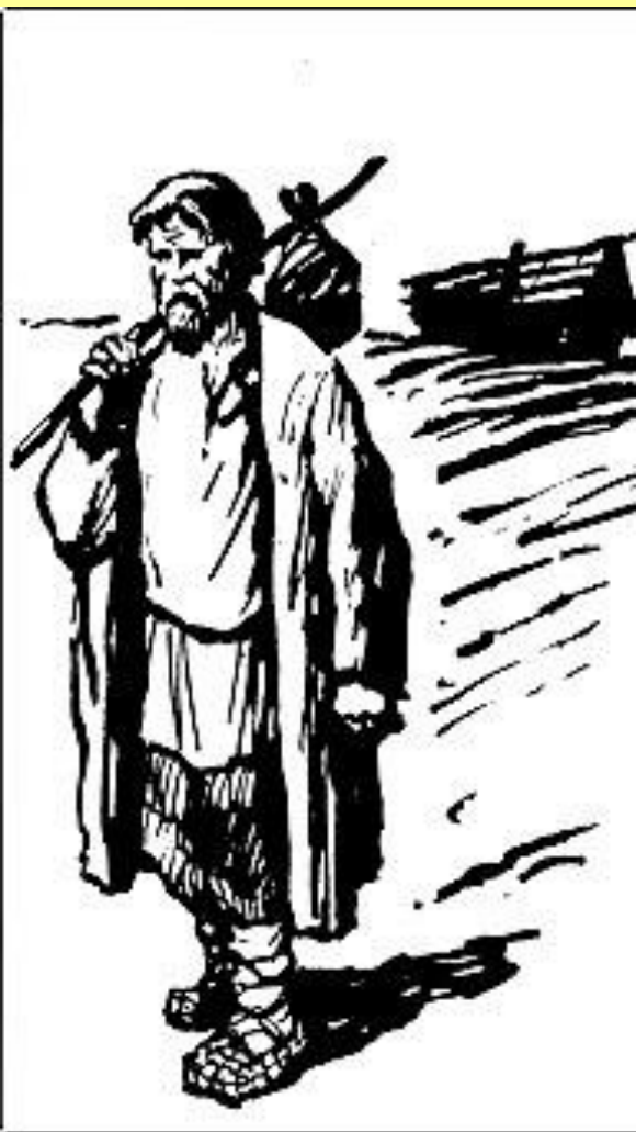
Крестьянин-отходник. Современный рисунок.

Наемными работниками на мануфактурах разбогатевших крестьян и купцов становились крестьяне, ушедшие на заработки для уплаты оброка.