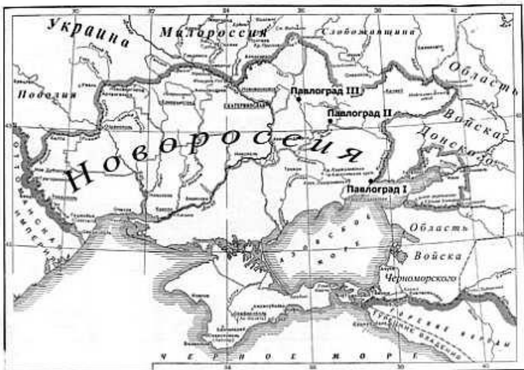
Карта Новороссии. Начало XIX в.

Осваивались новые сельскохозяйственные земли в Новороссии: в Приазовье, Крыму, в Новороссии, стремясь привлечь в Новороссию кавказцев, предоставляло всем желающим, исключая крепостных, по 60 дес., а помещикам, пожелавшим переселить в Новороссию свои крестьян, – от 1,5 тыс. до 12 тыс. дес.