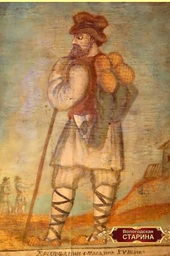
Крестьянин- отходник. Рис. XIX века.

Оброк во 2-й половине XVIII в. взимался преимущественно в денежной форме. Размеры оброка за 60–90-е гг. XVIII в. возросли с 1–3 руб. до 5–10 руб. с ревизской души.