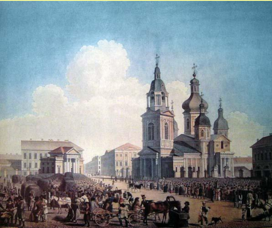
Сенная площадь в Санкт-Петербурге Худ. А.П. Брюллов

Хозяйственная специализация районов стимулировала рост торговли.