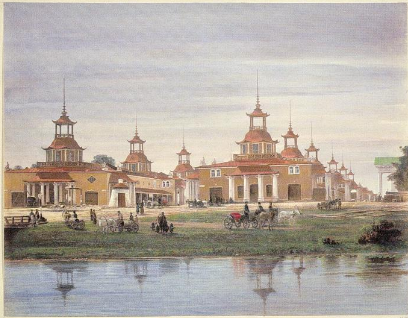
✿ Китайские ярмарочные ряды. ✿

Китайские торговые ряды на Макарьевской ярмарке.