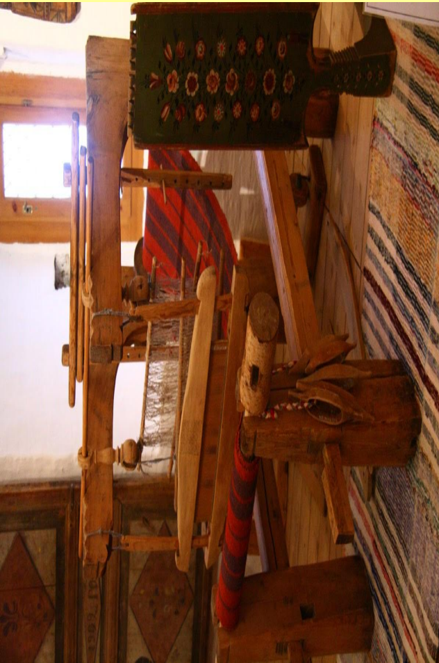
Ткацкий станок и прялка.