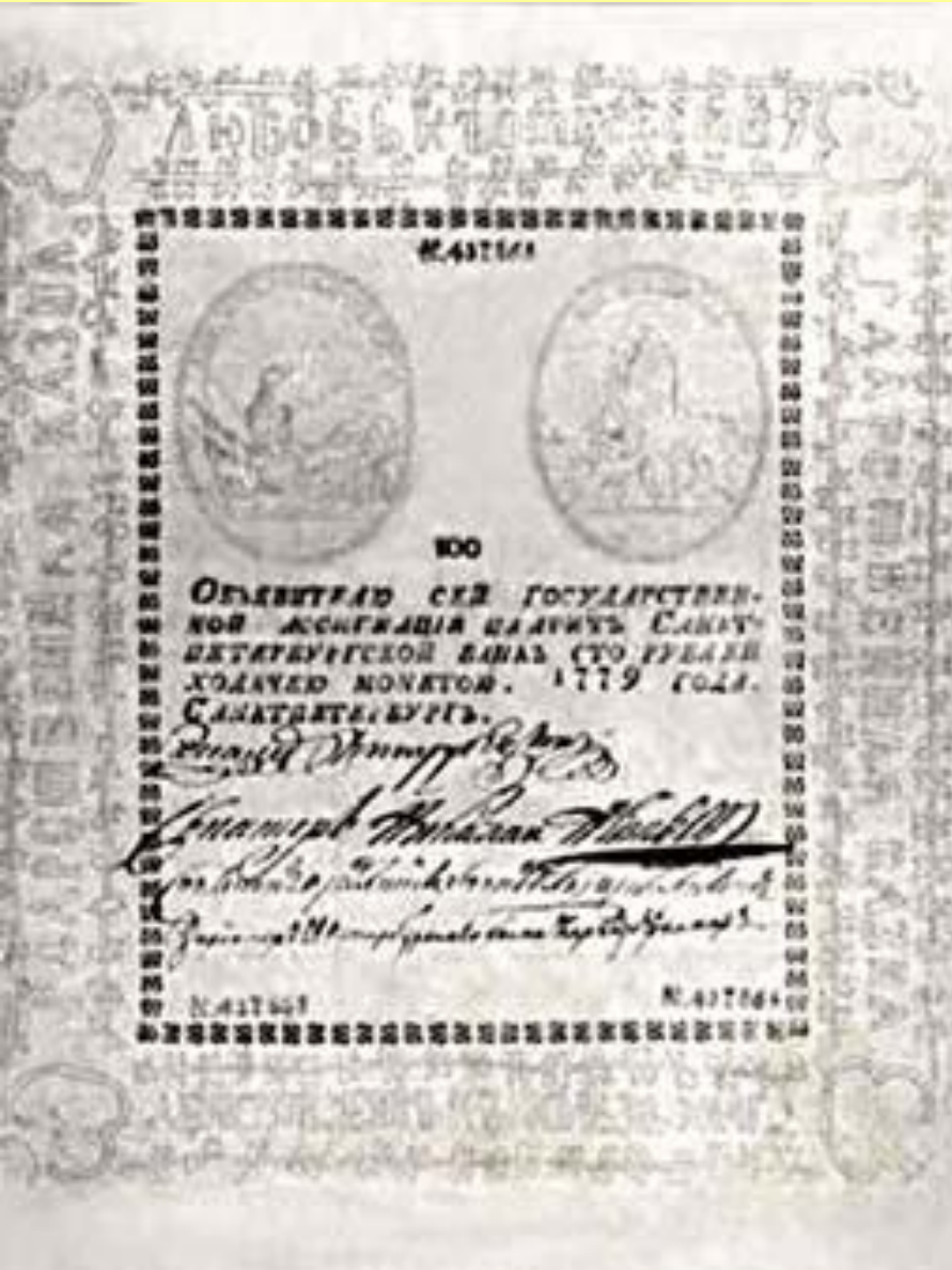
100-рублевая ассигнация. 1779 г.

Курс рубля ассигнациями к 90-м гг. упал до 70 коп. серебром.