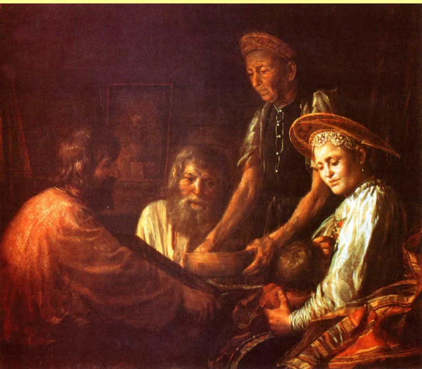
Крестьянский обед. Худ. М. Шибанов.

Как и прежде, подавляющую часть населения составляли крестьяне: