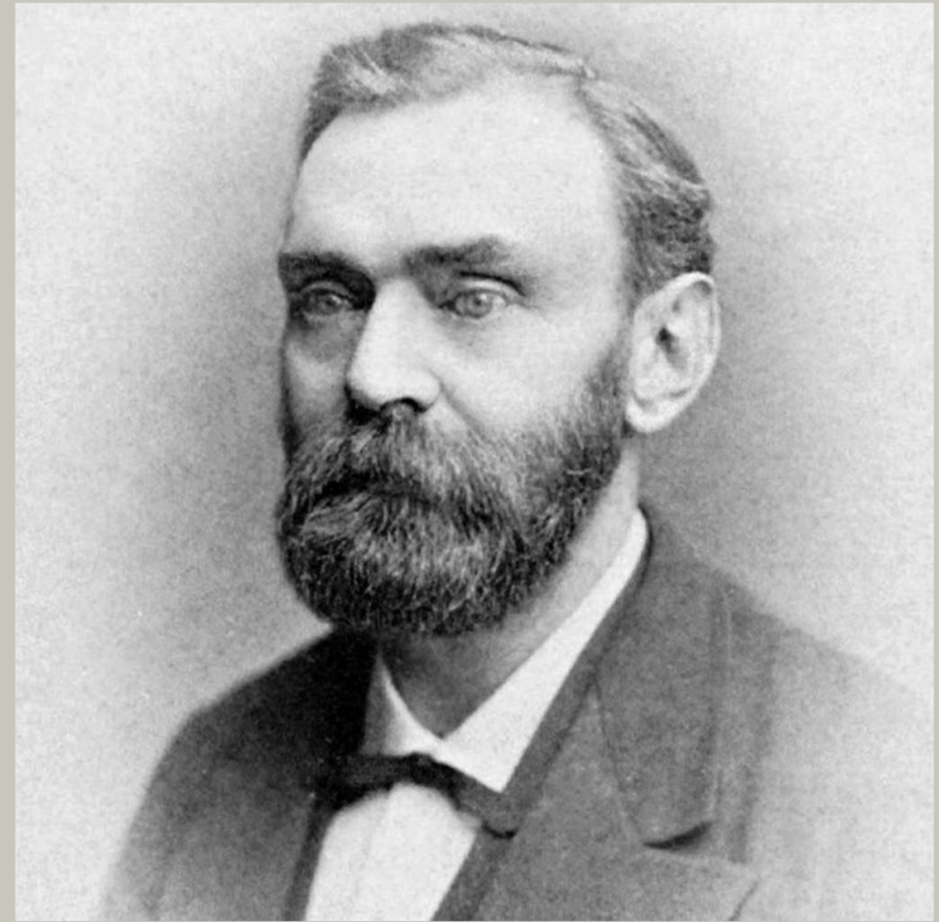
АЛЬФРЕД НОБЕЛЬ (10 дек. 1896г.)