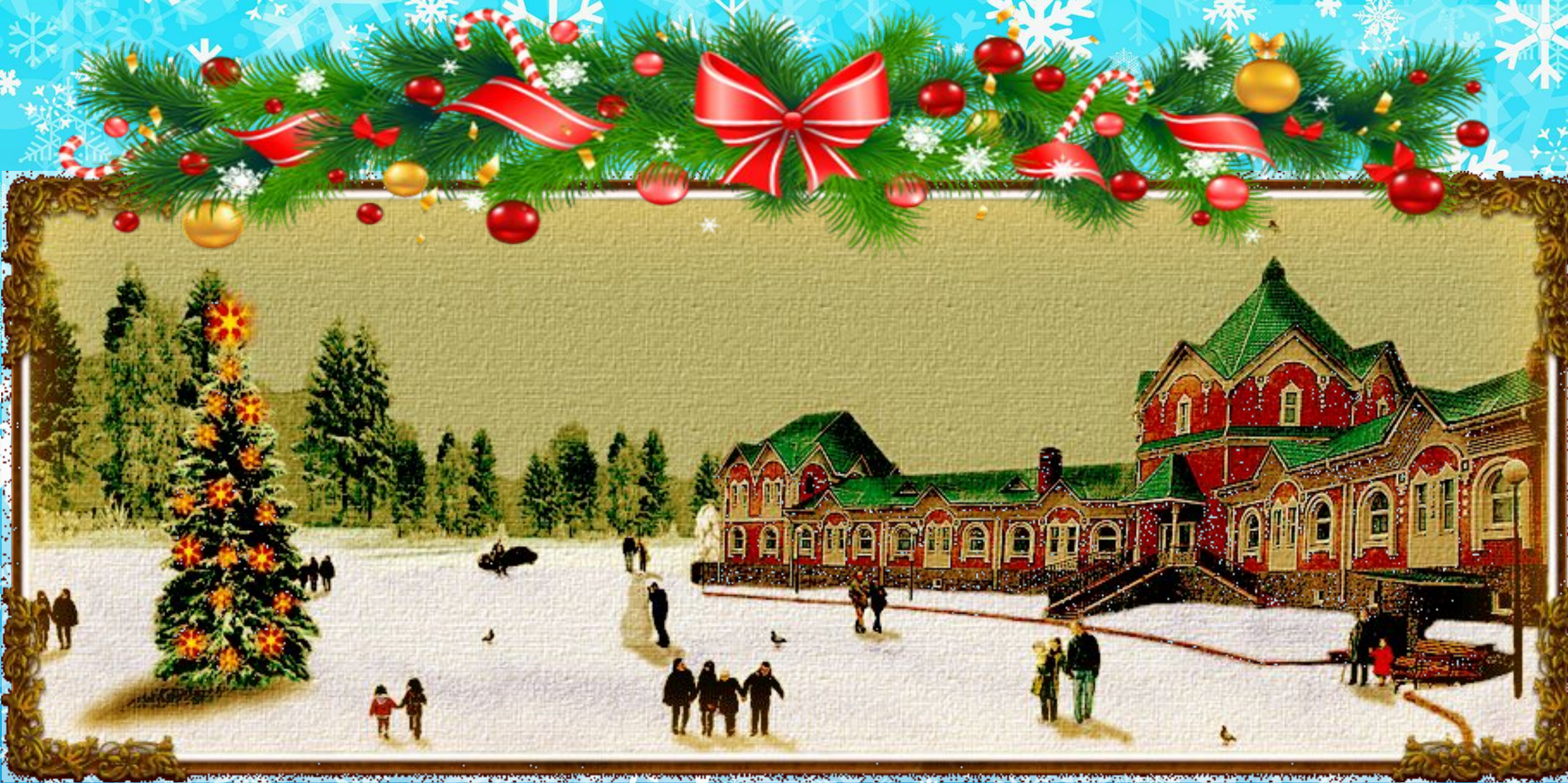
Фабрика «Ёлочка» в городе Клин