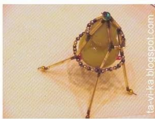
Бусы на ёлку из стекляруса, 50-е