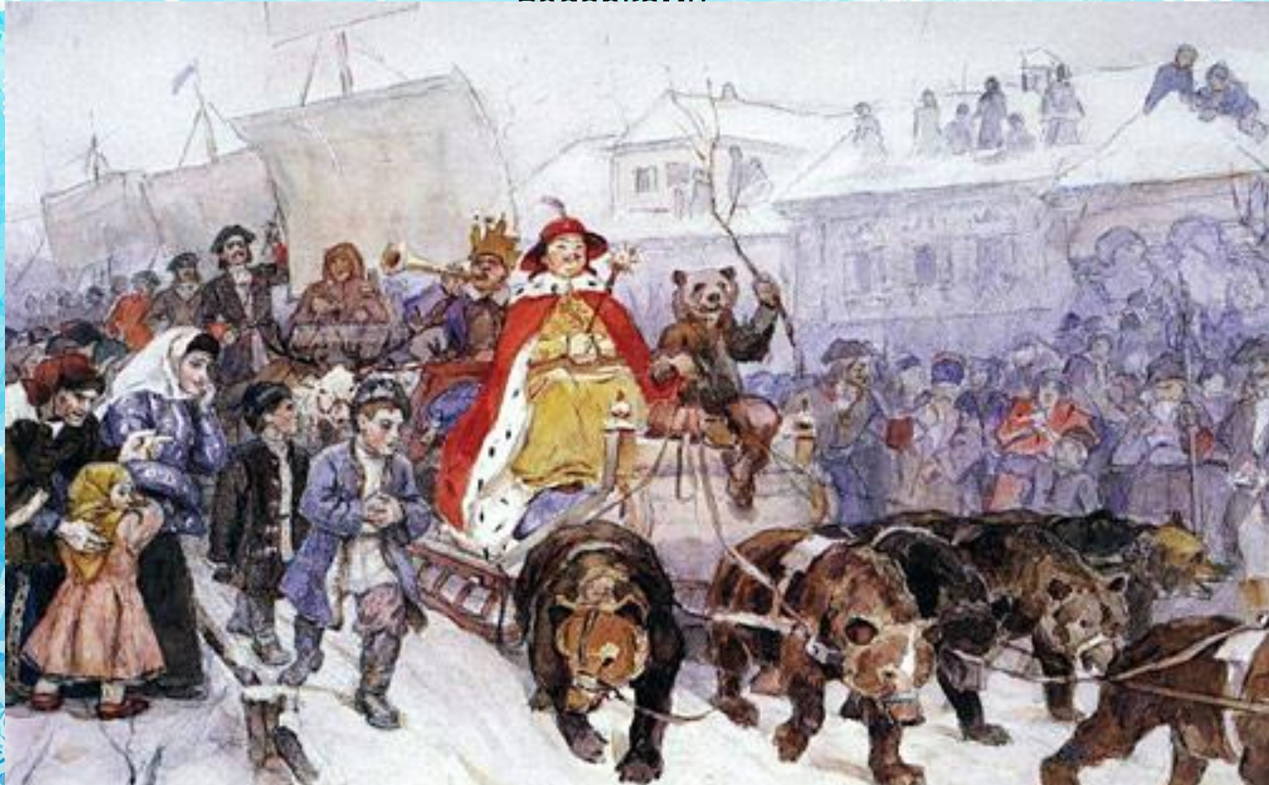
Василий Суриков «Большой маскарад в 1772 году на улицах Москвы с участием Петра I и князя-кесаря И.Ф. Ромодановского».