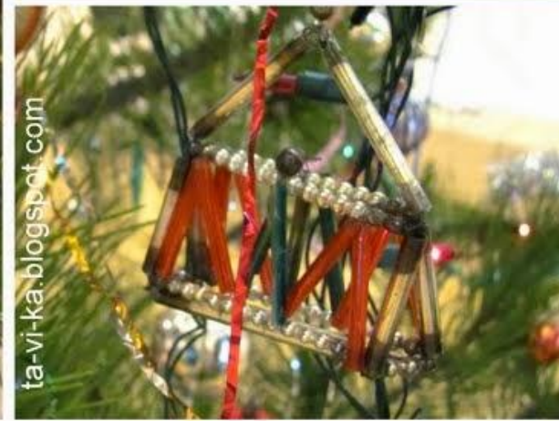
Елочные наборные игрушки из стеклянных бус, 50-е гг.