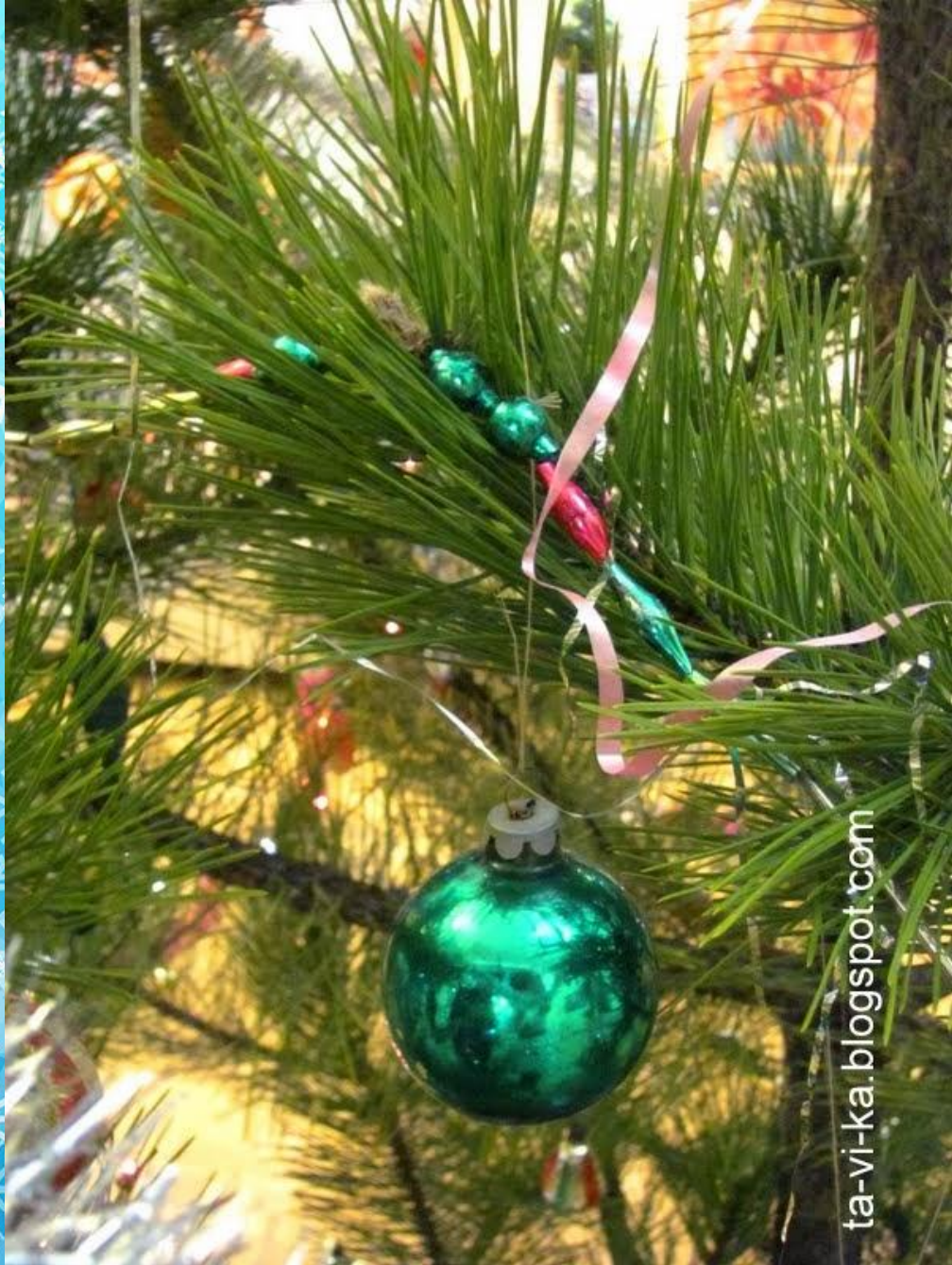
Бусы на ёлку из стекляруса, 50-е