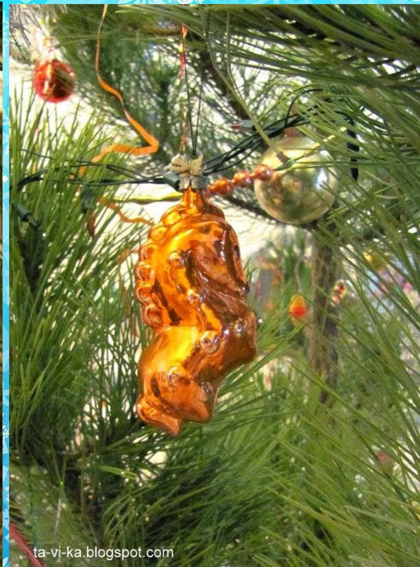
Доктор Айболит, 60-е гг.