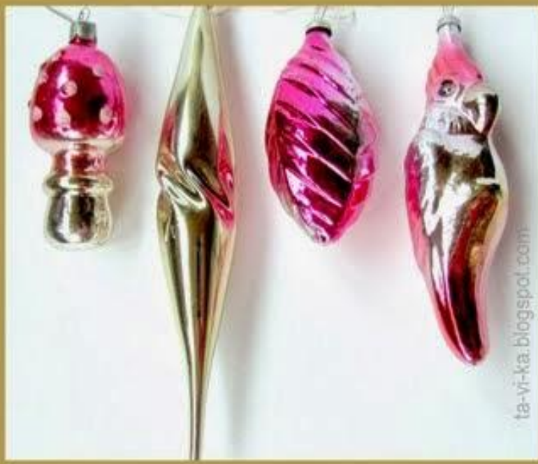
Ёлочные игрушки 70-80х гг.