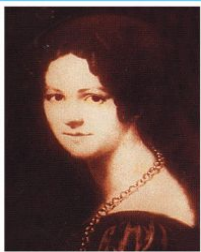
Екатерина Ивановна Трубецкая

Имя героини - в заглавии I части поэмы, указание подзаголовка – 1826 г. – поэт восхищается поступком этой женщины, она первая добилась разрешения поехать к мужу в Сибирь.