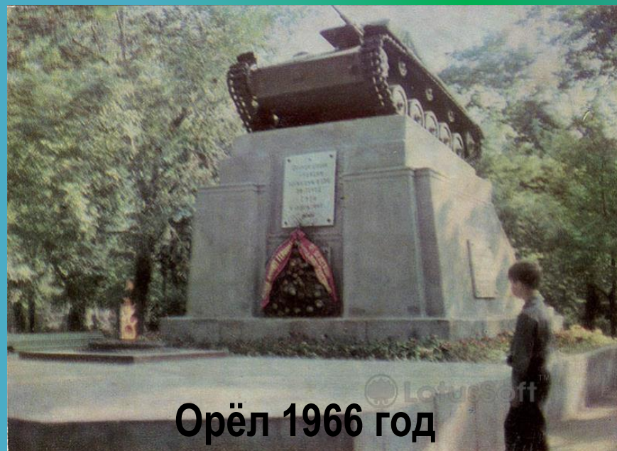
Орёл 1966 год

4 августа 1943 года при освобождении города танкисты 17-й Гвардейской танковой бригады, которой было присвоено почётное звание Орловской, первыми ворвались в Орёл. 6 августа в Первомайском сквере состоялся траурный митинг и захоронение в братской могиле воинов — танкистов, погибших при освобождении города. 7 августа на земляном холме был установлен подбитый танк « T-70 » роты ст. лейтенанта Сергея Марченко. С этого момента сквер стал называться сквером Танкистов