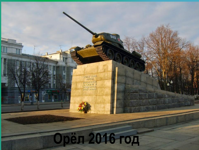
Орёл 2016 год