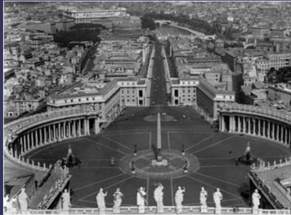
Лоренцо Берніні. Колонада площі перед Собором Святого Петра. Рим