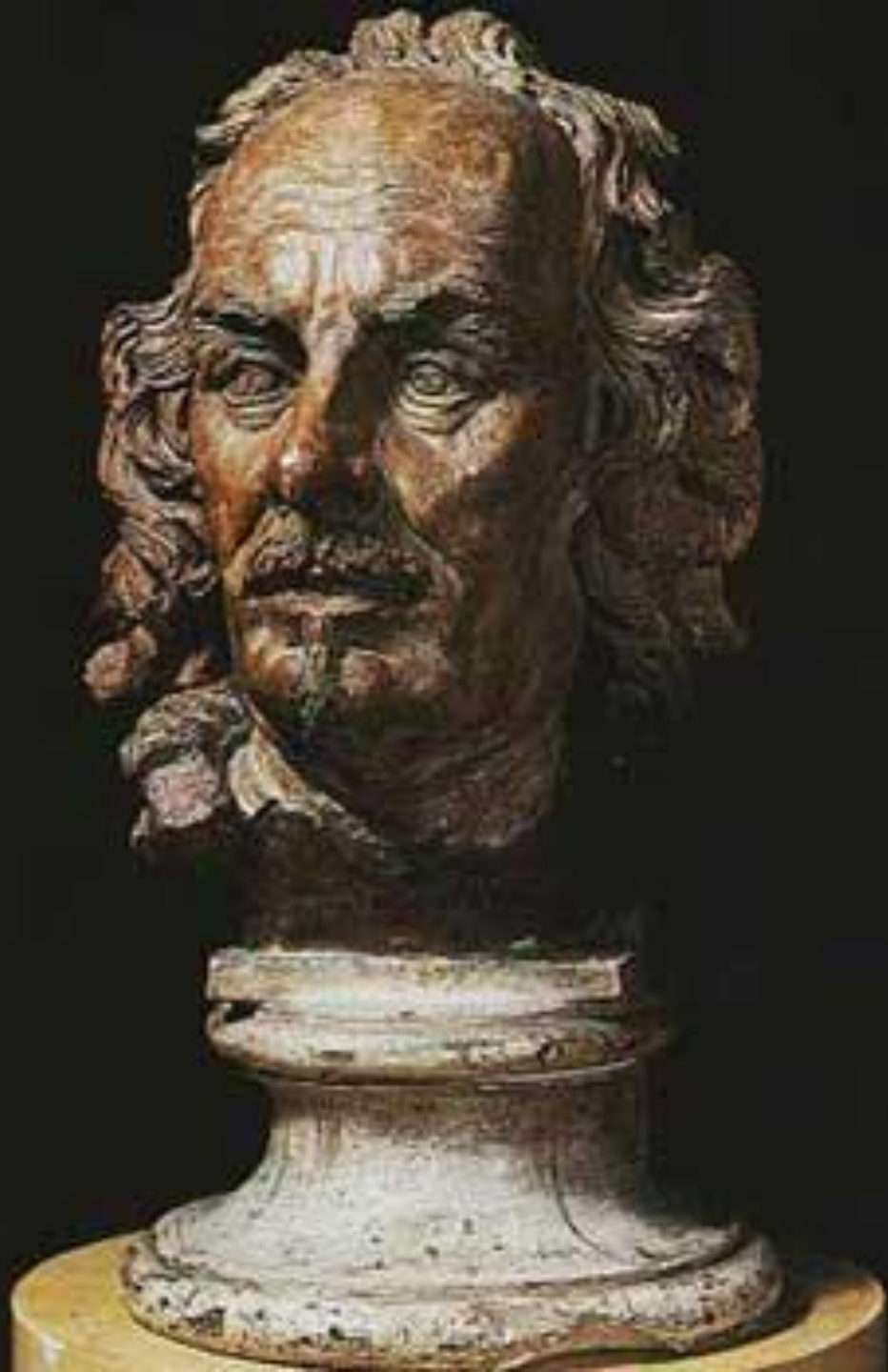
Лоренцо Бернини (1598-1680)