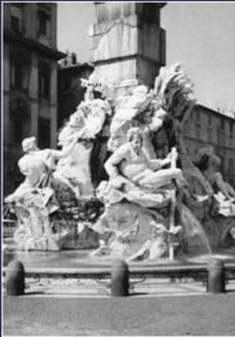
Лоренцо Берніні. Фонтан чотирьох рік на Пьяцца Навона. Рим