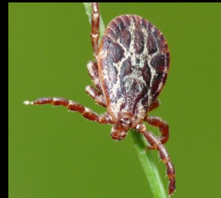
Степной (пастбищный) клещ