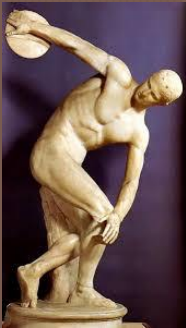
«Дискобол» Скульптор – Мирон