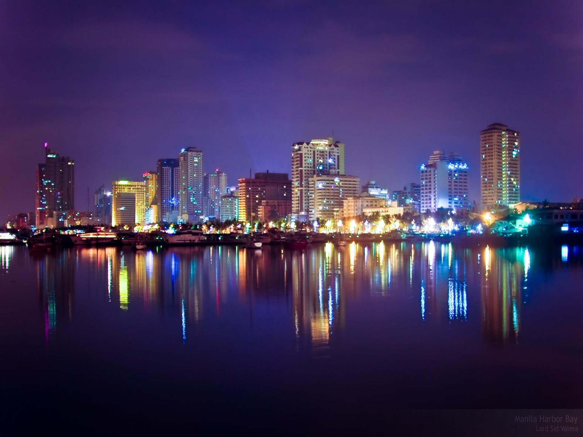
Manila Harbor Bay Lord Sid Valera