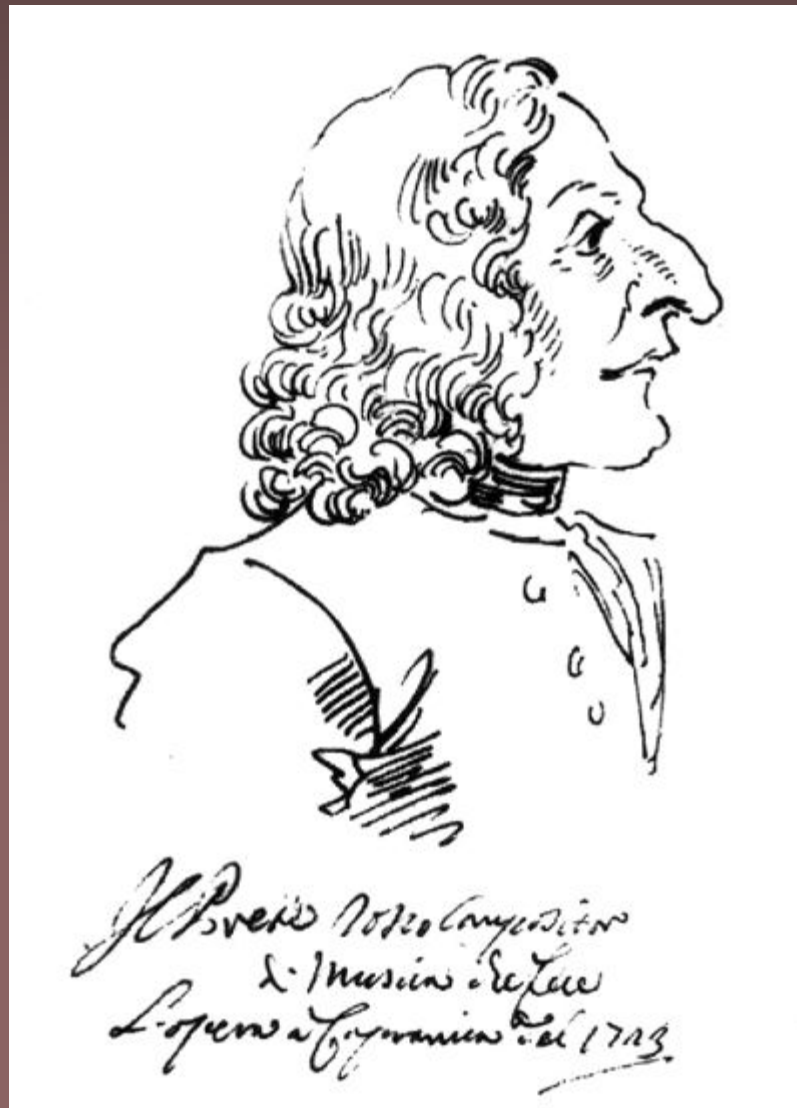
Карикатура на Вивальди — «Рыжий священник», нарисованная в 1723 году итальянским художником Пьер Леоне Гецци.