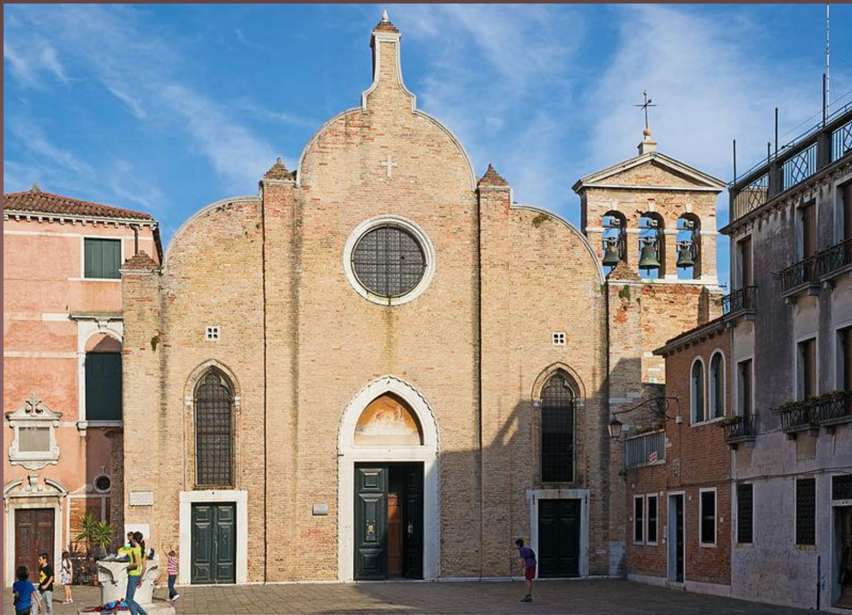
Церковь Святого Иоанна в Брагоре, где в 1678 году был крещён Антонио Вивальди.