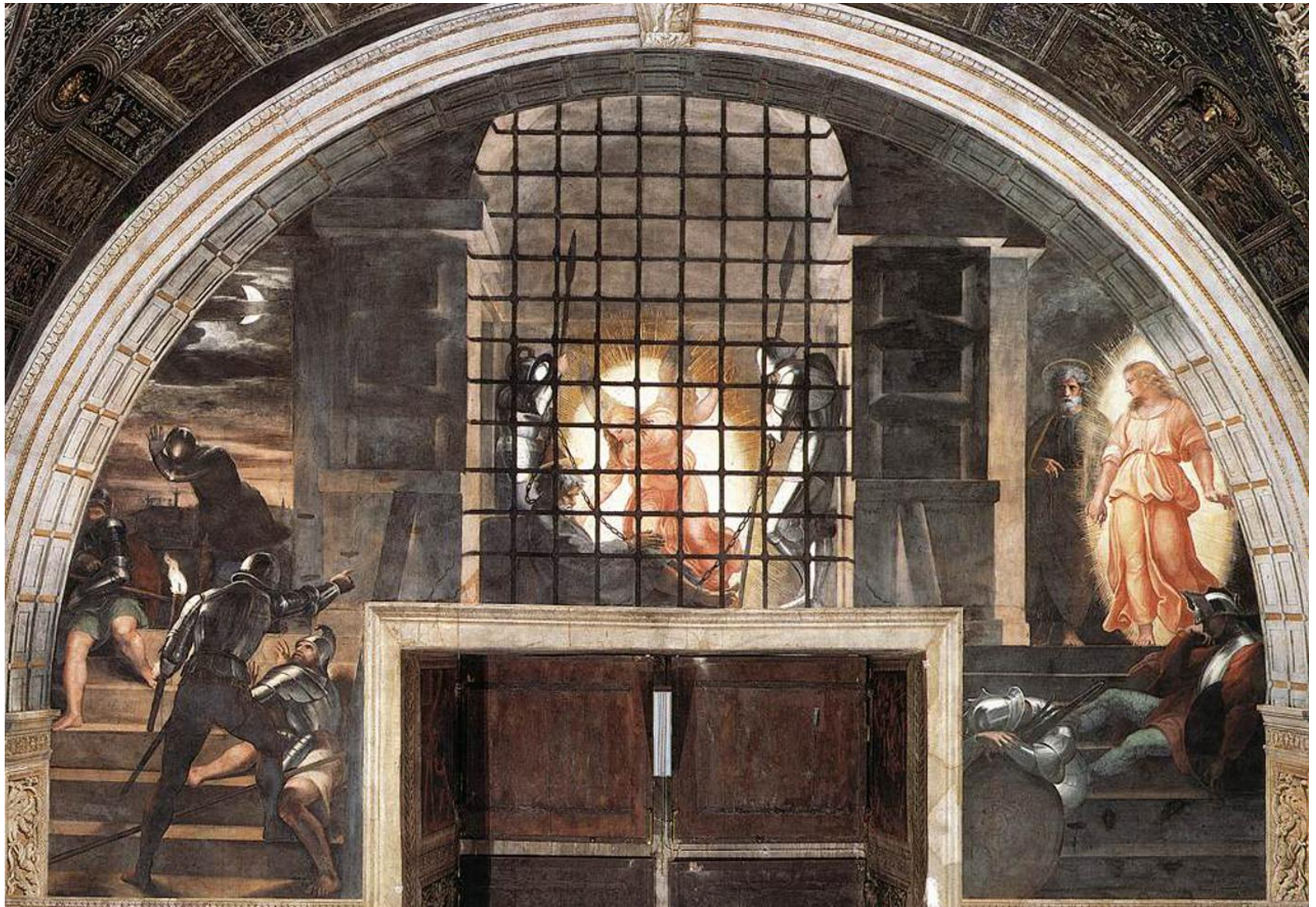
Изведение апостола Петра из темницы