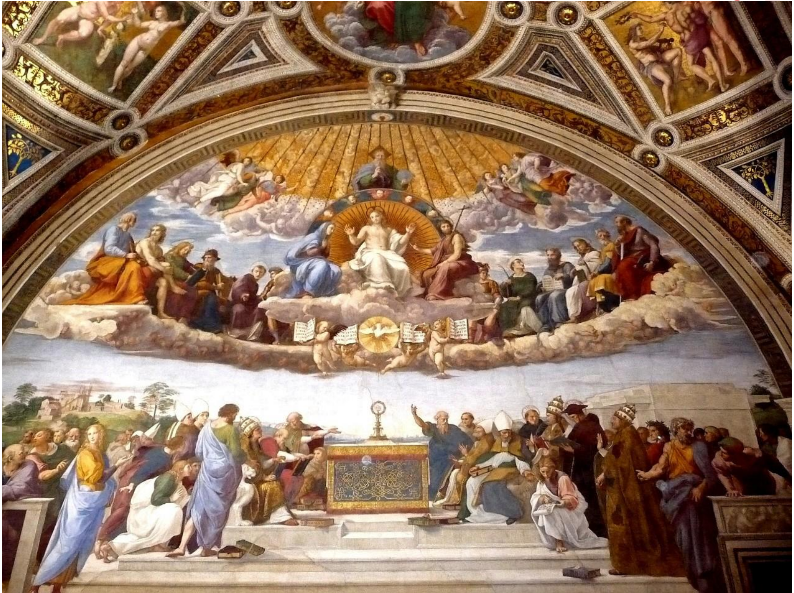
Диспут о святом причастии