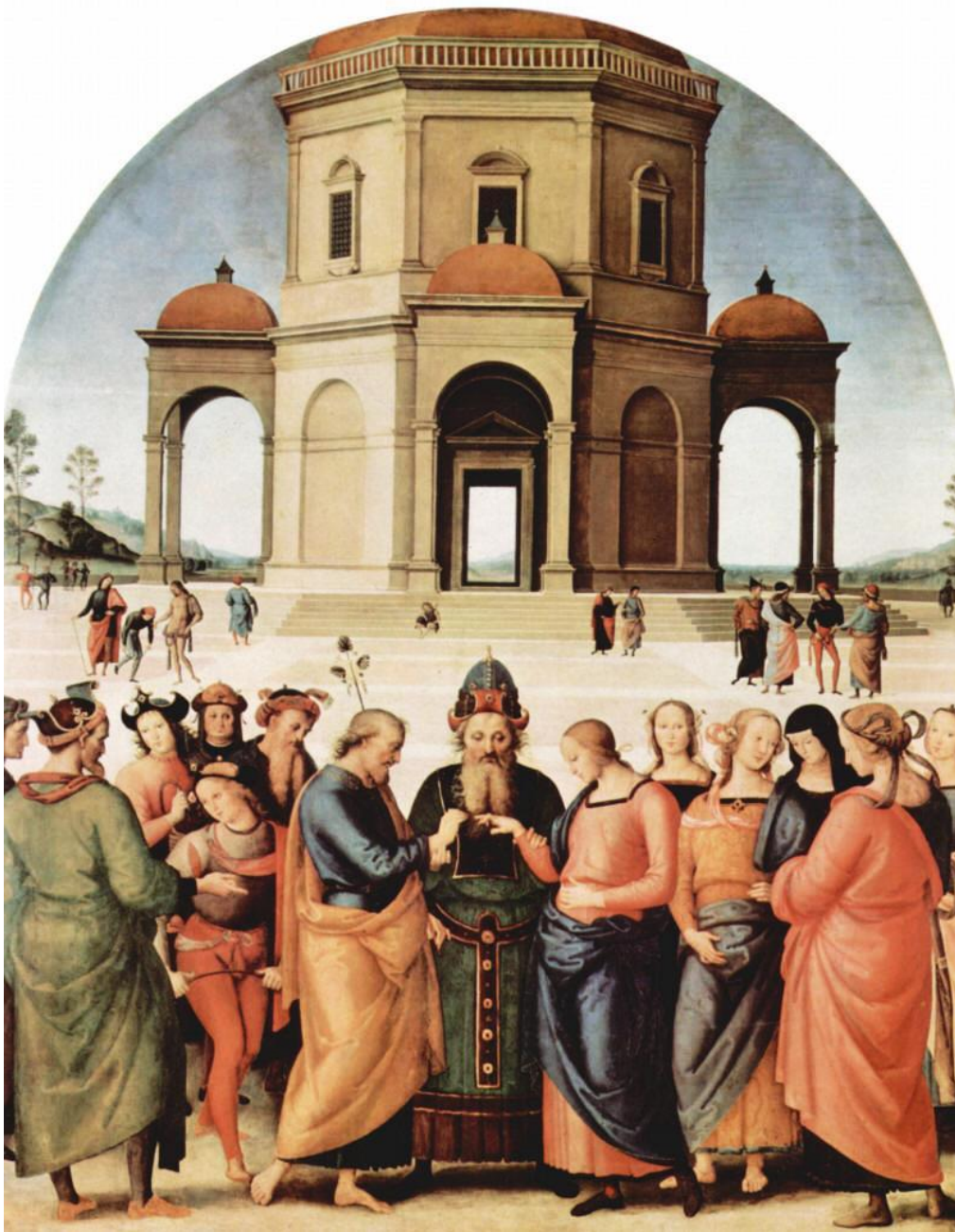
Перуджино Обручение Марии