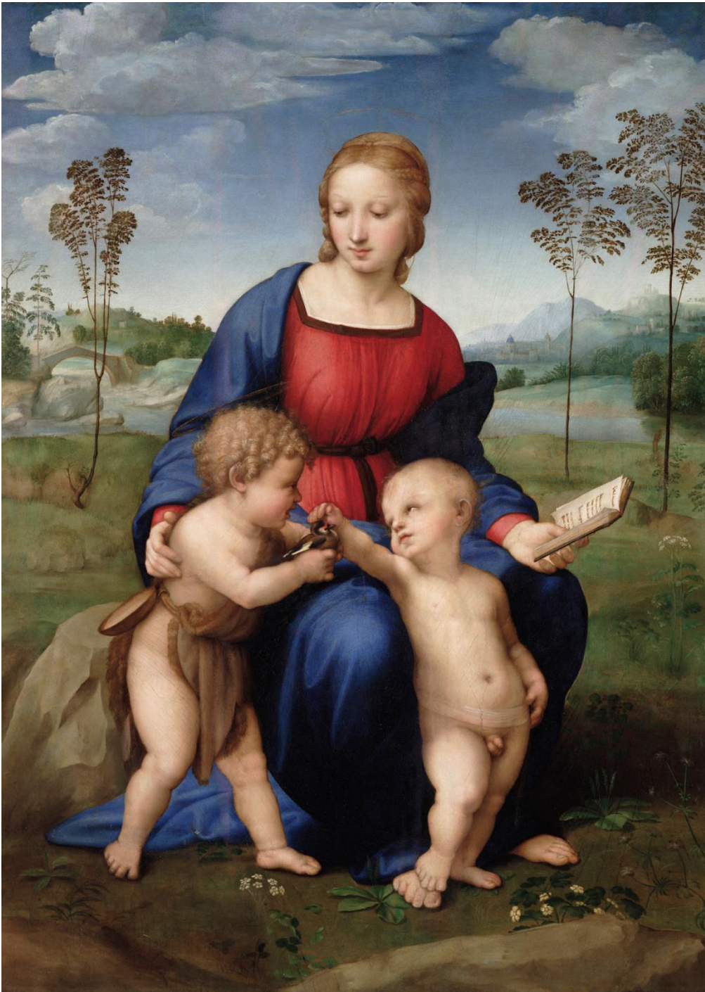
Мадонна со щеглёнком