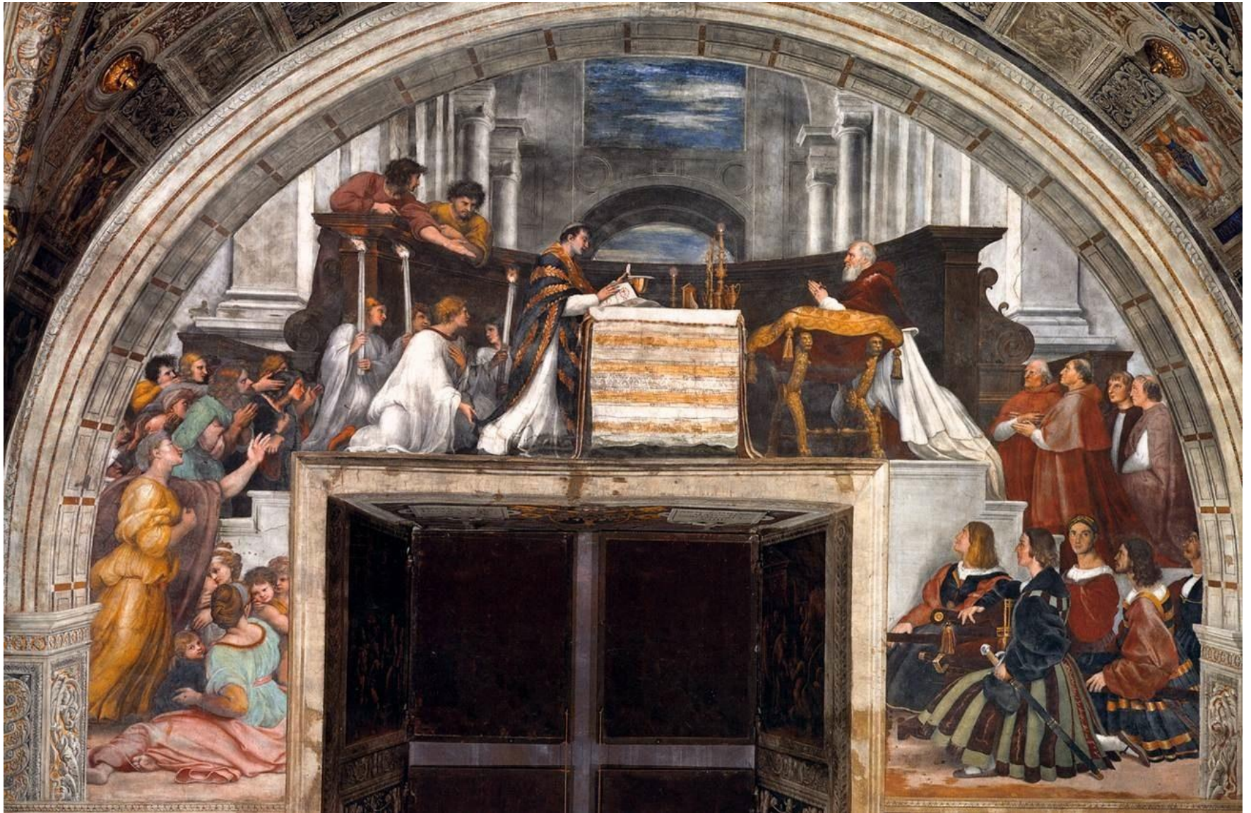
Месса в Больсене