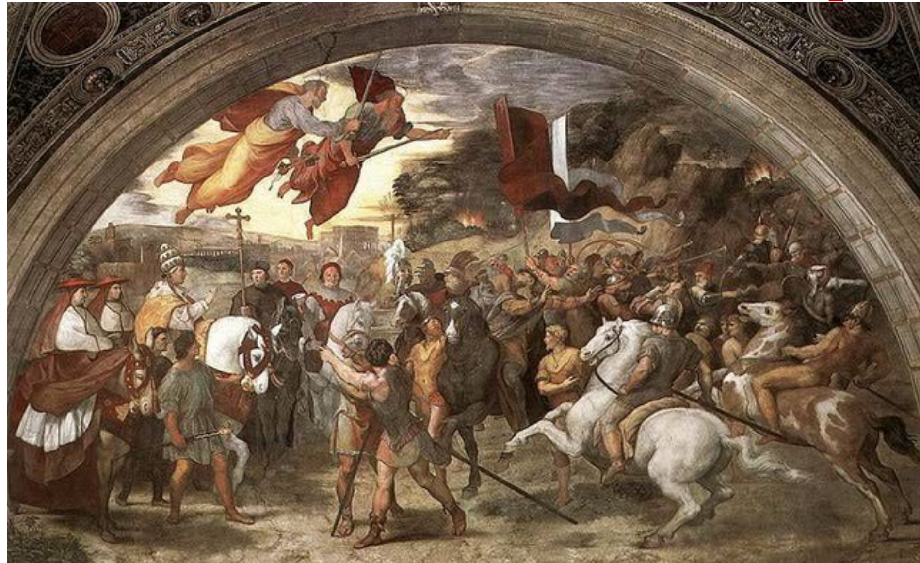
Встреча Льва Великого с Аттілой