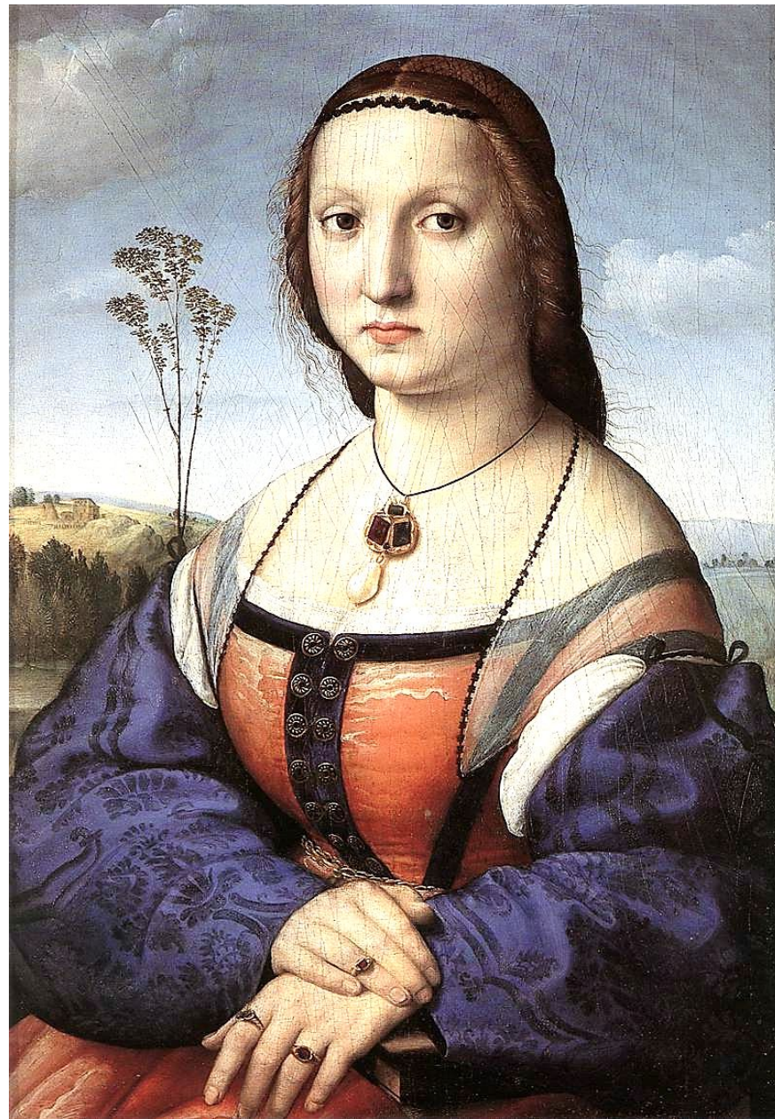
Парный портрет Аньоло и Магдалены Дони