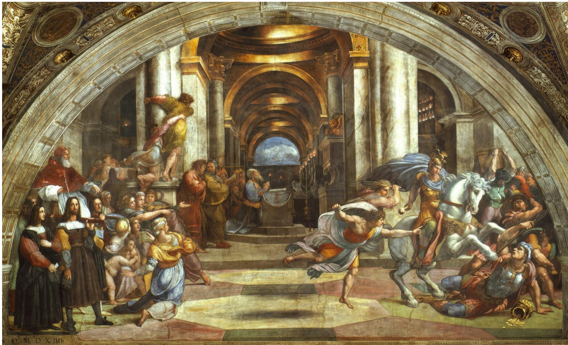
Изгнание Гелиодора из храма