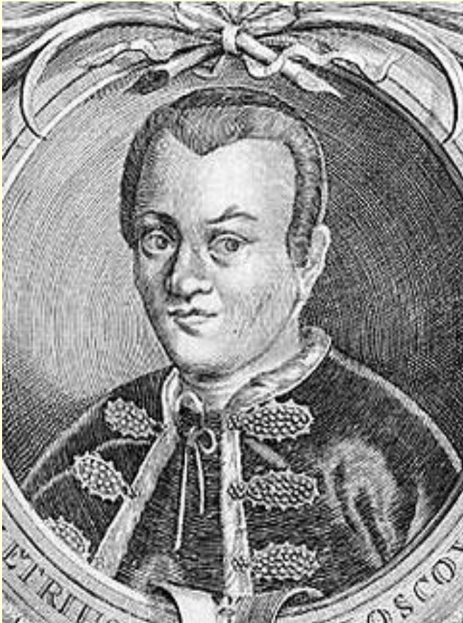
Петр I Гравюра XVII в.

Стремителен, чужд торжественной дворцовой медлительности.