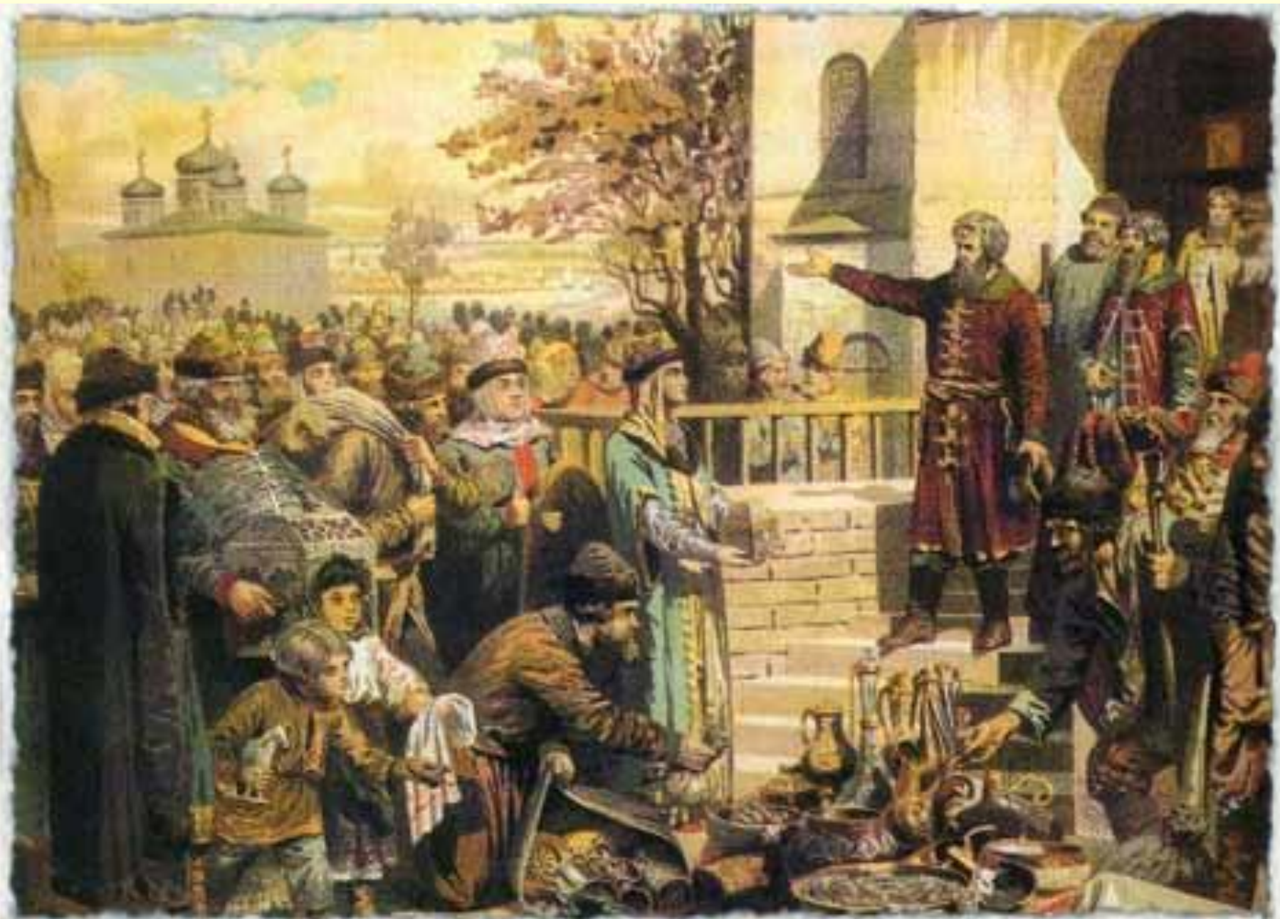
Нижегородцы откликаются на призыв Минина собрать средства для ополчения.