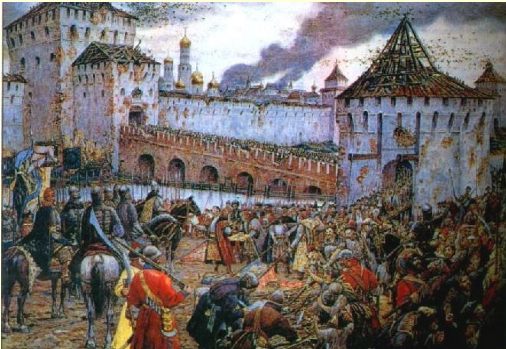
Польские паны сдаются русским ополченцам. 26 октября 1612 г. освобожден Кремль.