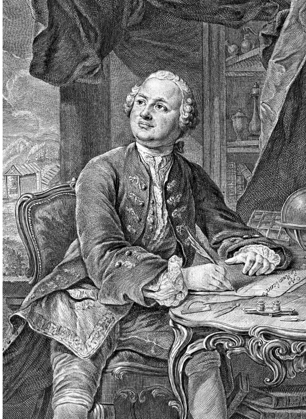
Э. Фессар и К. А. Вортман. М. В. Ломоносов. Гравюра, 1757 г.