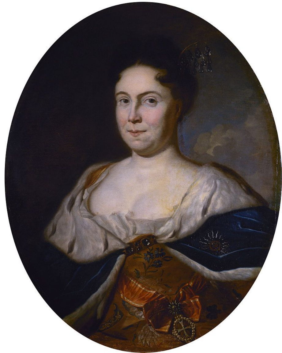
Портрет Екатерины I. Карел де Моор, 1717 год.

«При Петре она светила не собственным светом, но заимствованным от великого человека, которого она была спутницею; у неё доставало умения держать себя на известной высоте, обнаруживать внимание и сочувствие к происходившему около неё движению; она была посвящена во все тайны ... Её положение, страх за будущее держали её умственные и нравственные силы в постоянном и сильном напряжении. Но вьющееся растение достигало высоты благодаря только тому великану лесов, около которого обвивалось; великан сражен — и слабое растение разостлалось по земле. Екатерина сохранила знание лиц и отношений между ними, сохранила привычку пробираться между этими отношениями; но у неё не было ни должного внимания к делам, особенно внутренним, и их подробностям, ни способности почина и направления»