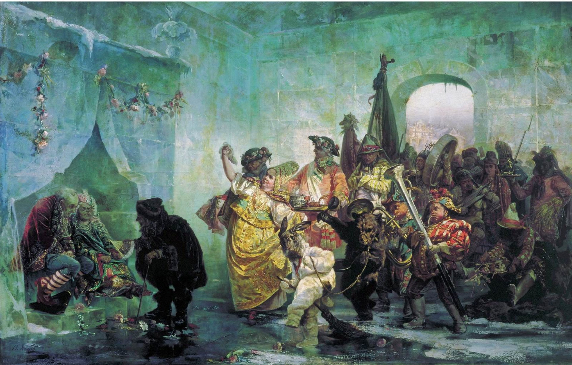
В. И. Якоби. Ледяной дом.