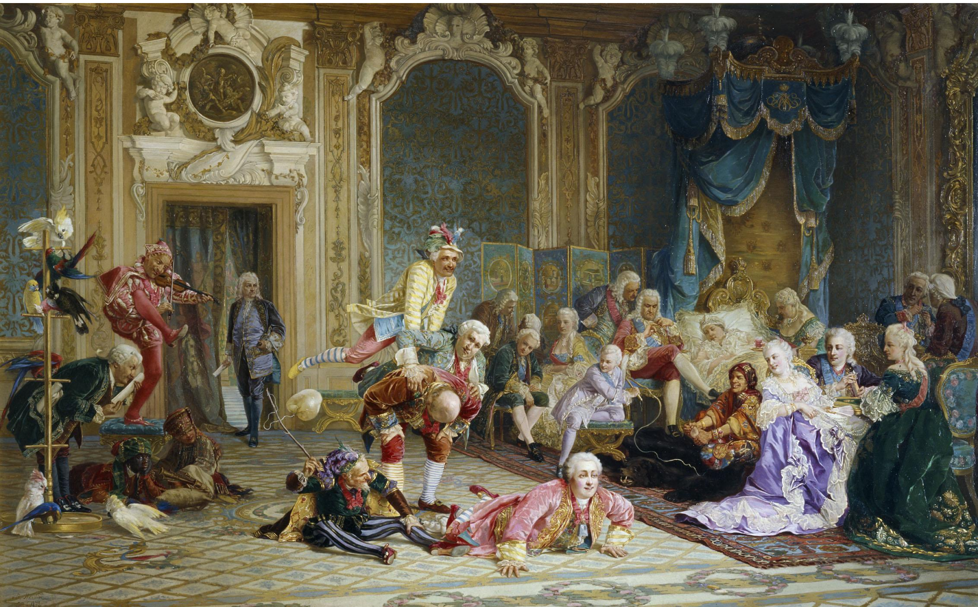
В. И. Якоби. Шуты при дворе Анны Иоанновны