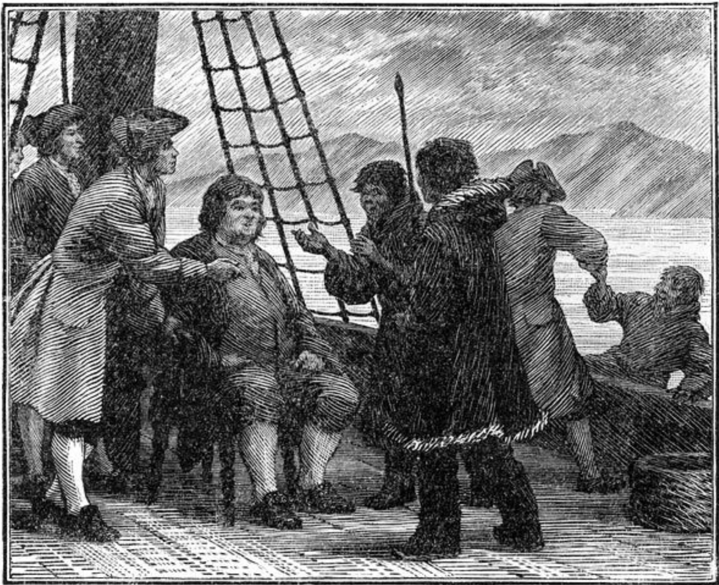
1724-1729 г.г. – экспедиция Витуса Беринга – Первая Камчатская экспедиция