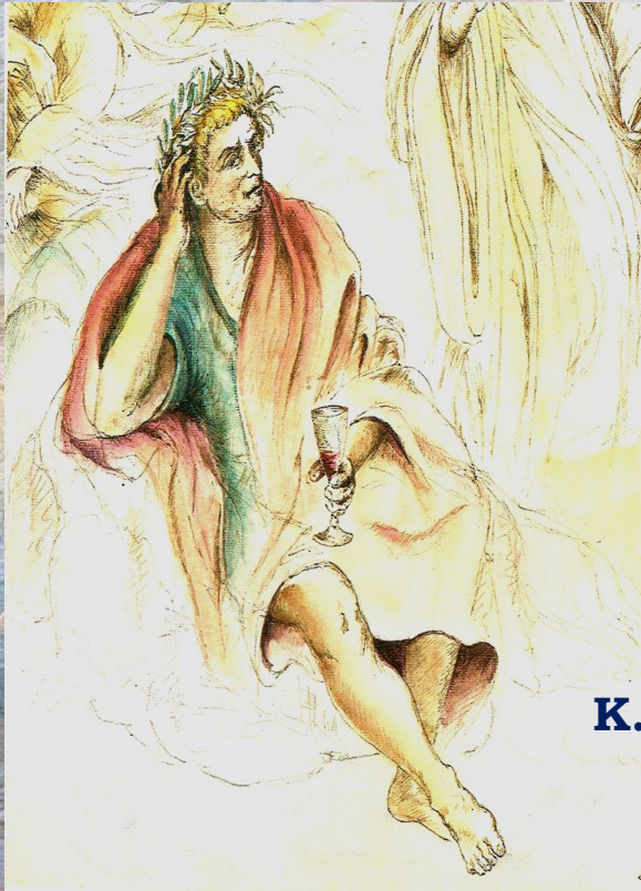
К. Гораций (65-8 гг. до н.э.) римский поэт

А выражения за мыслью придут сами собой ».