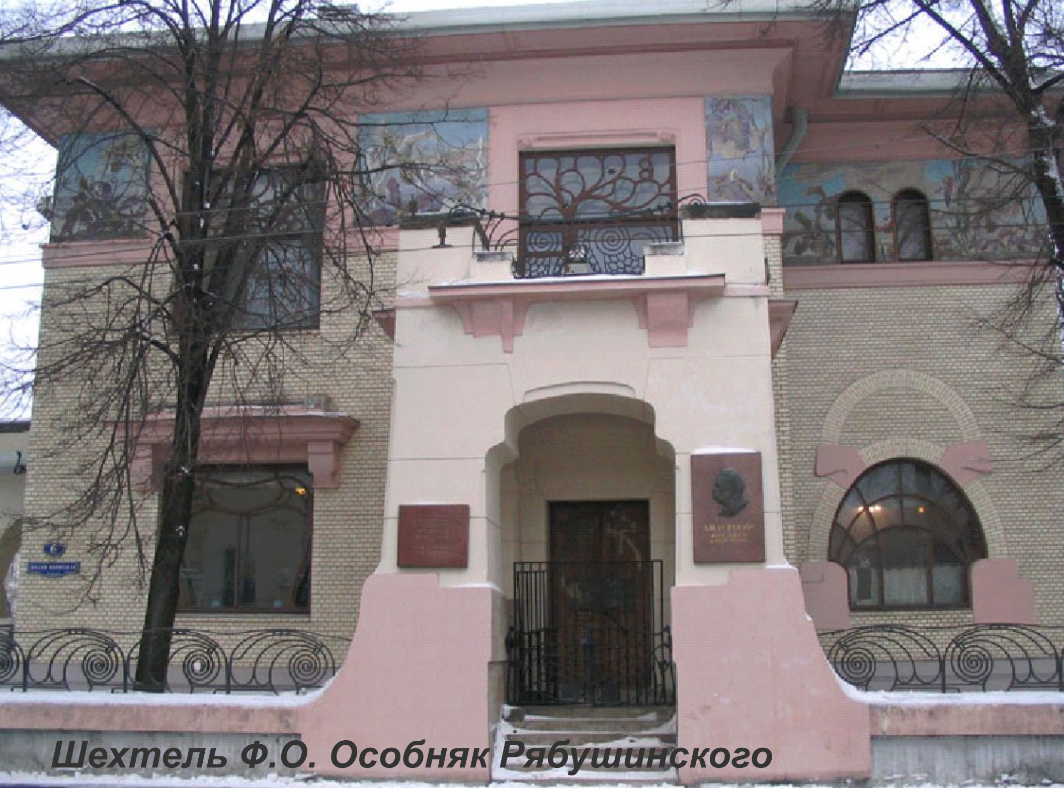
Шехтель Ф.О. Особняк Рябушинского