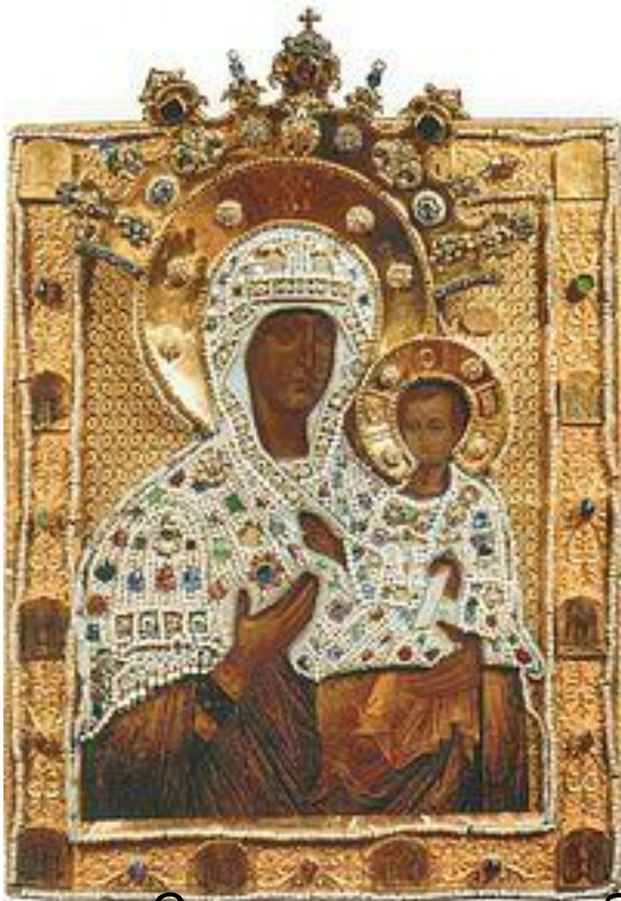
Смоленская икона божьей Матери 1456г.