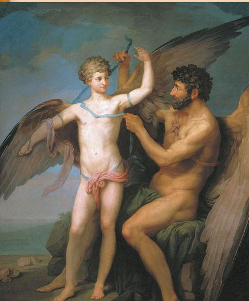
Дедал и сын его Икар