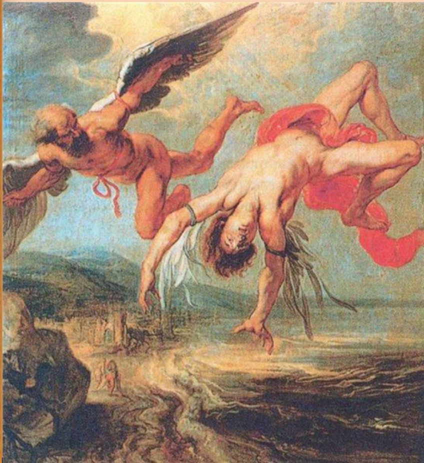
Дедал и сын его Икар