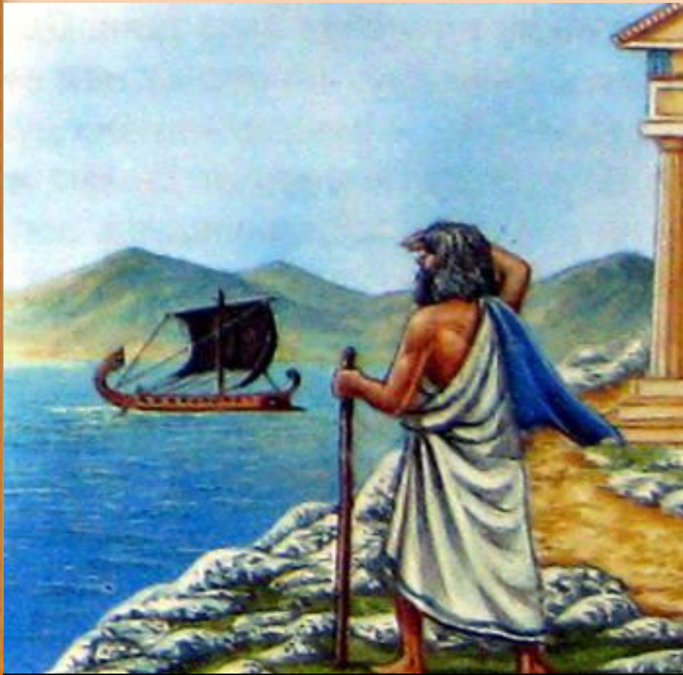
Царь Эгей на берегу моря

« Афиняне! Я узнаю корабль, но не могу различить цвет паруса! »