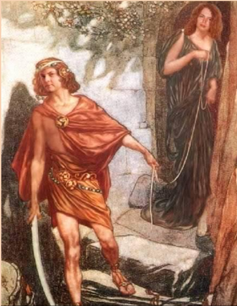
Ариадна и Тесей

Красота Тесея тронула сердце царской дочери Ариадны и она решает помочь юноше остаться в живых. Обратившись к знаменитому мастеру Дедалу, она дала Тесею клубок ниток и меч.