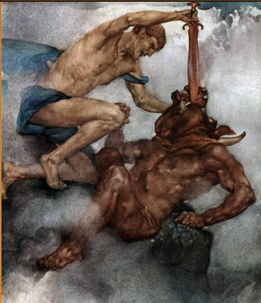
Тесей убивает Минотавра

Минотавр – это чудовище, имеющее тело человека и голову быка.