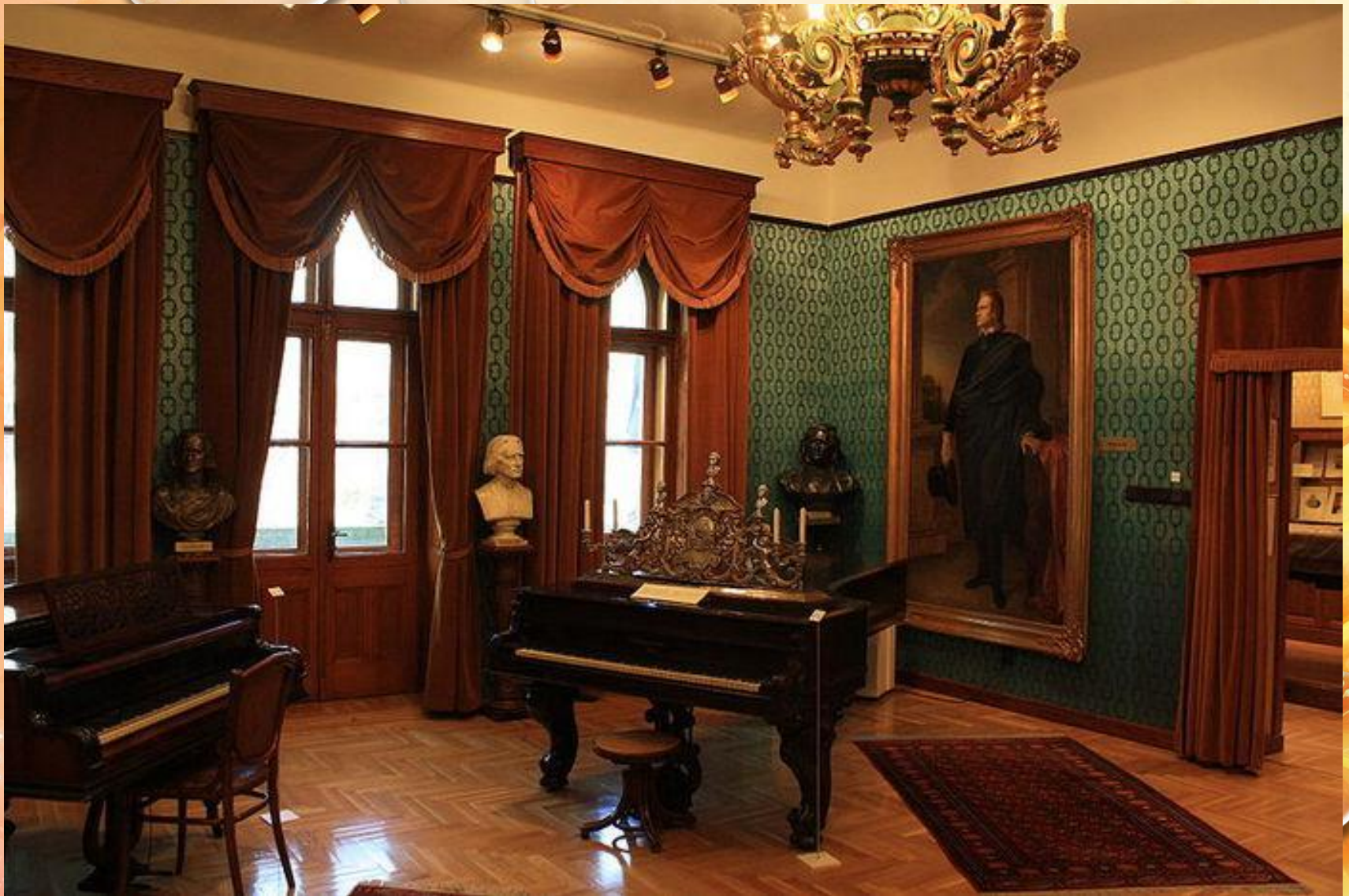
Будинок-музей Ліста у Веймері