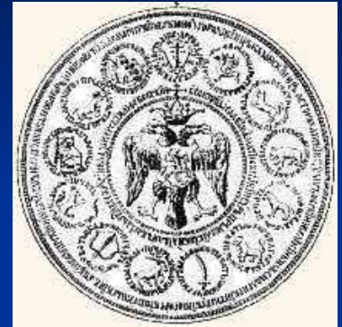
Печать Ивана Грозного