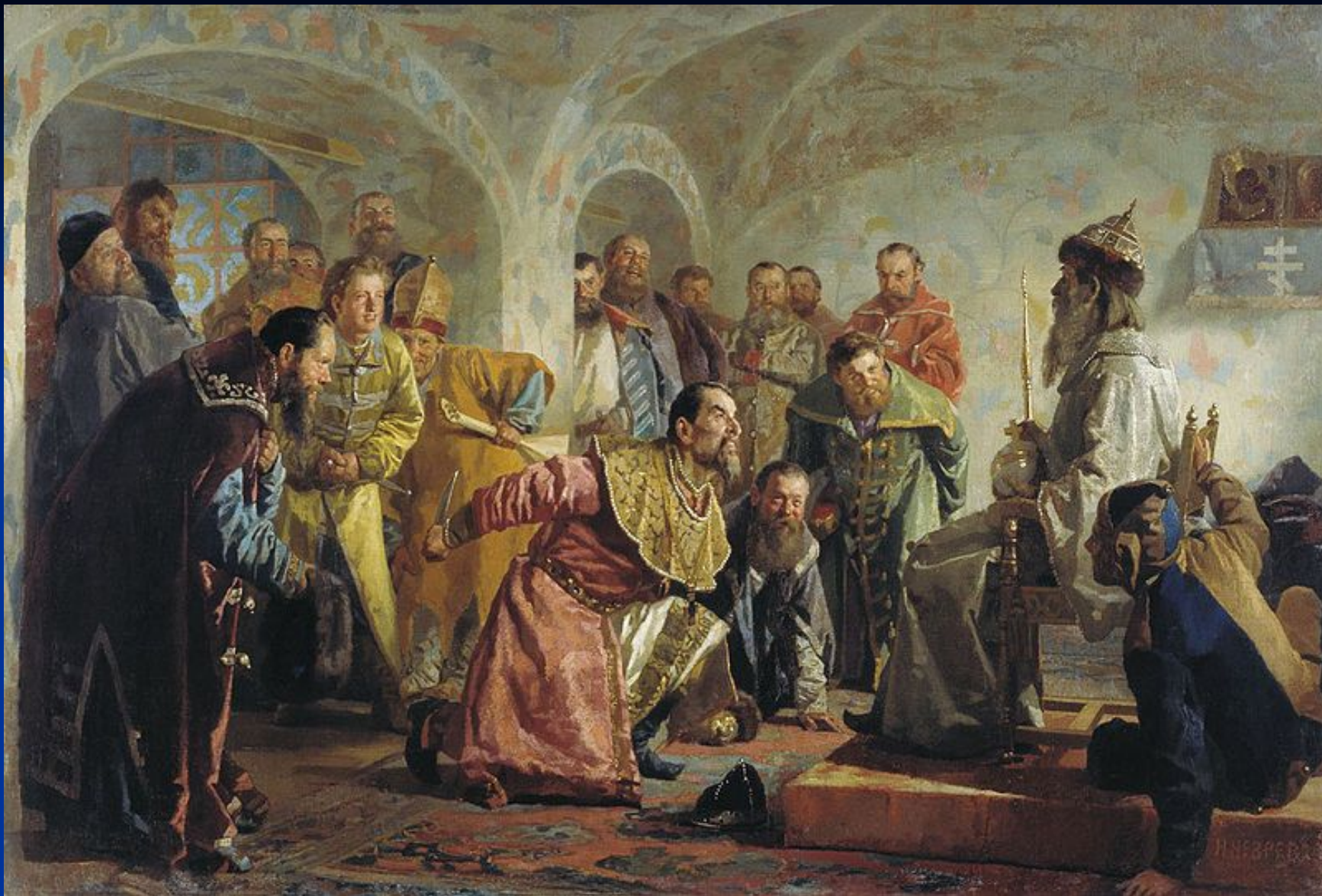
Картина Н. В. Неврева «Опричники». Изображено убийство боярина И. П. Фёдорова (1568), которого Грозный, обвинив в желании захватить власть, заставил надеть царские одежды и сесть на трон, после чего зарезал