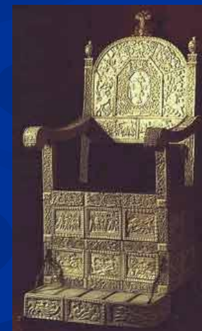
Трон Ивана Грозного