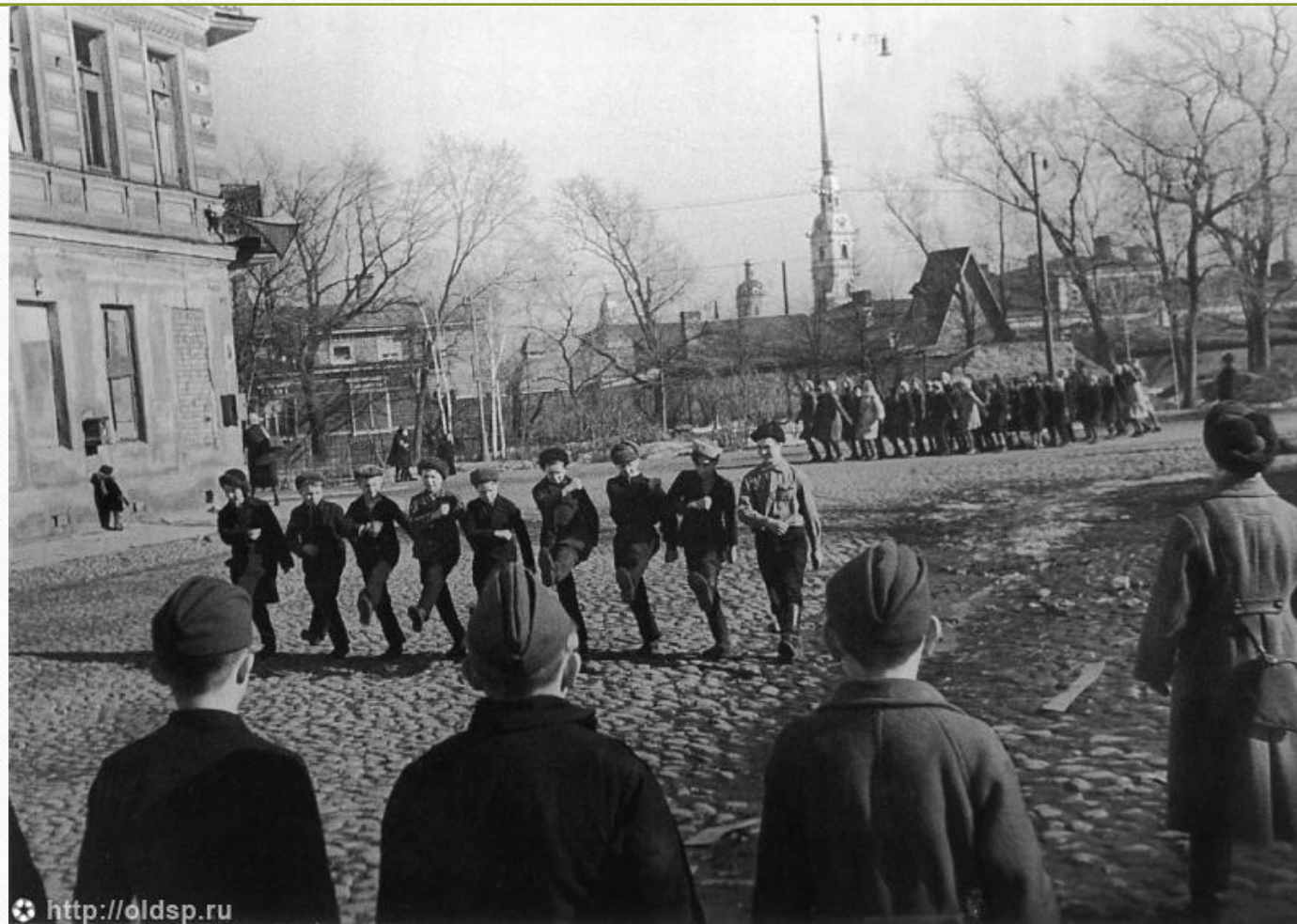
Петрозаводская ул., д.12. Здание построено в 1937 г. До войны здесь была школа, потом госпиталь...