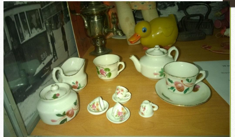
Четырёхкомнатная квартира № 50, откуда началось путешествие блокадных игрушек.