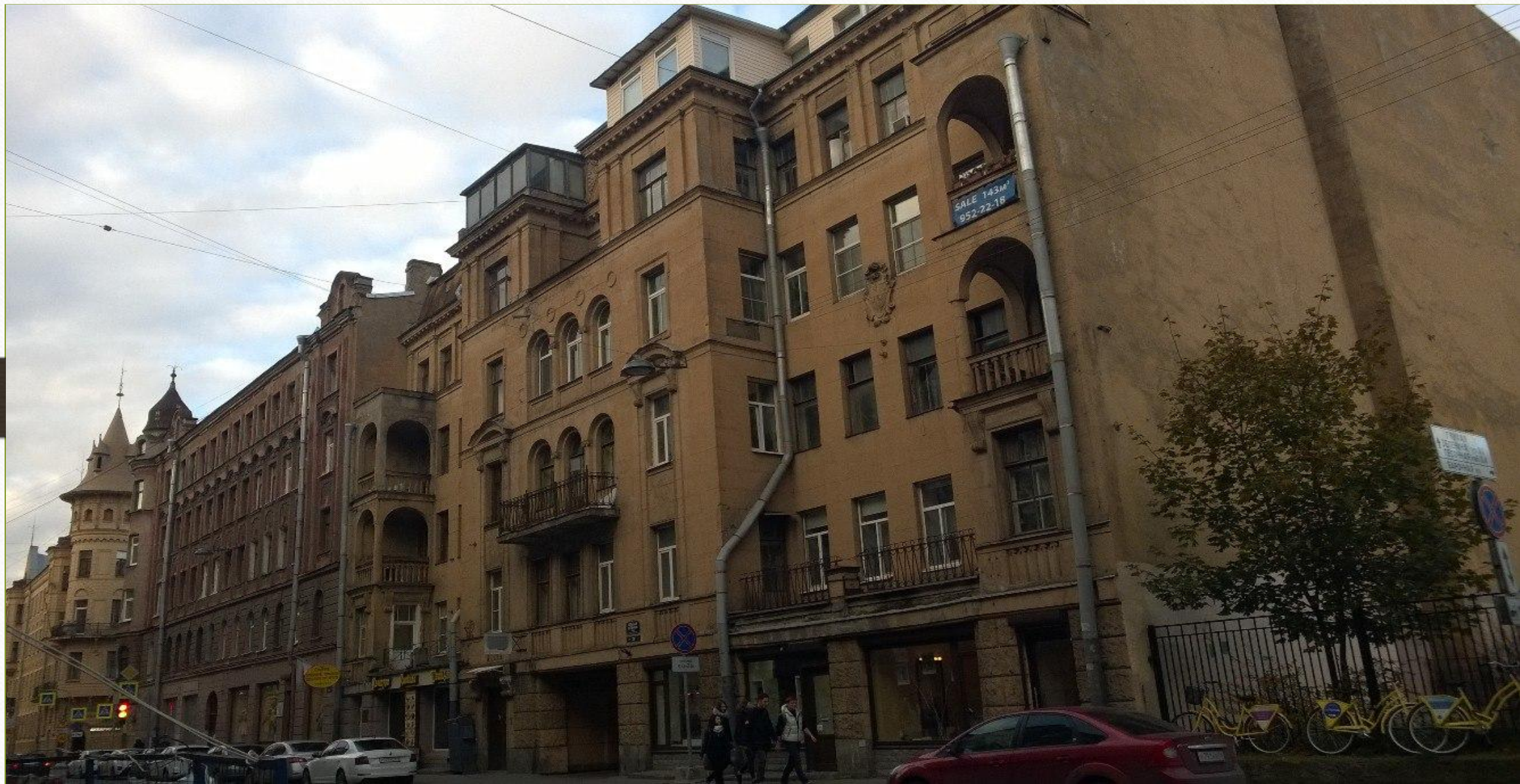
Большая Зеленая дом № 29.