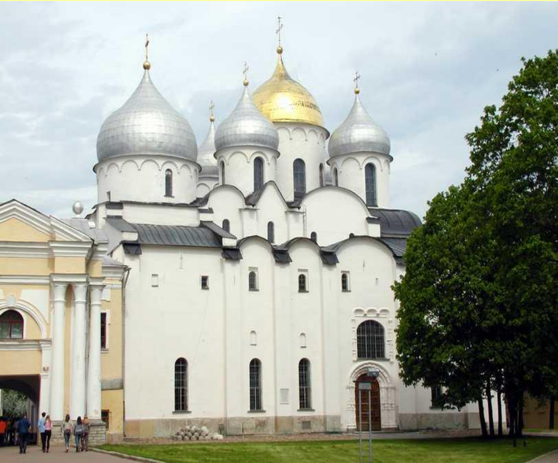
Собор Святой Софии в Новгороде

Новгородцы называли свой город «домом Святой Софии».