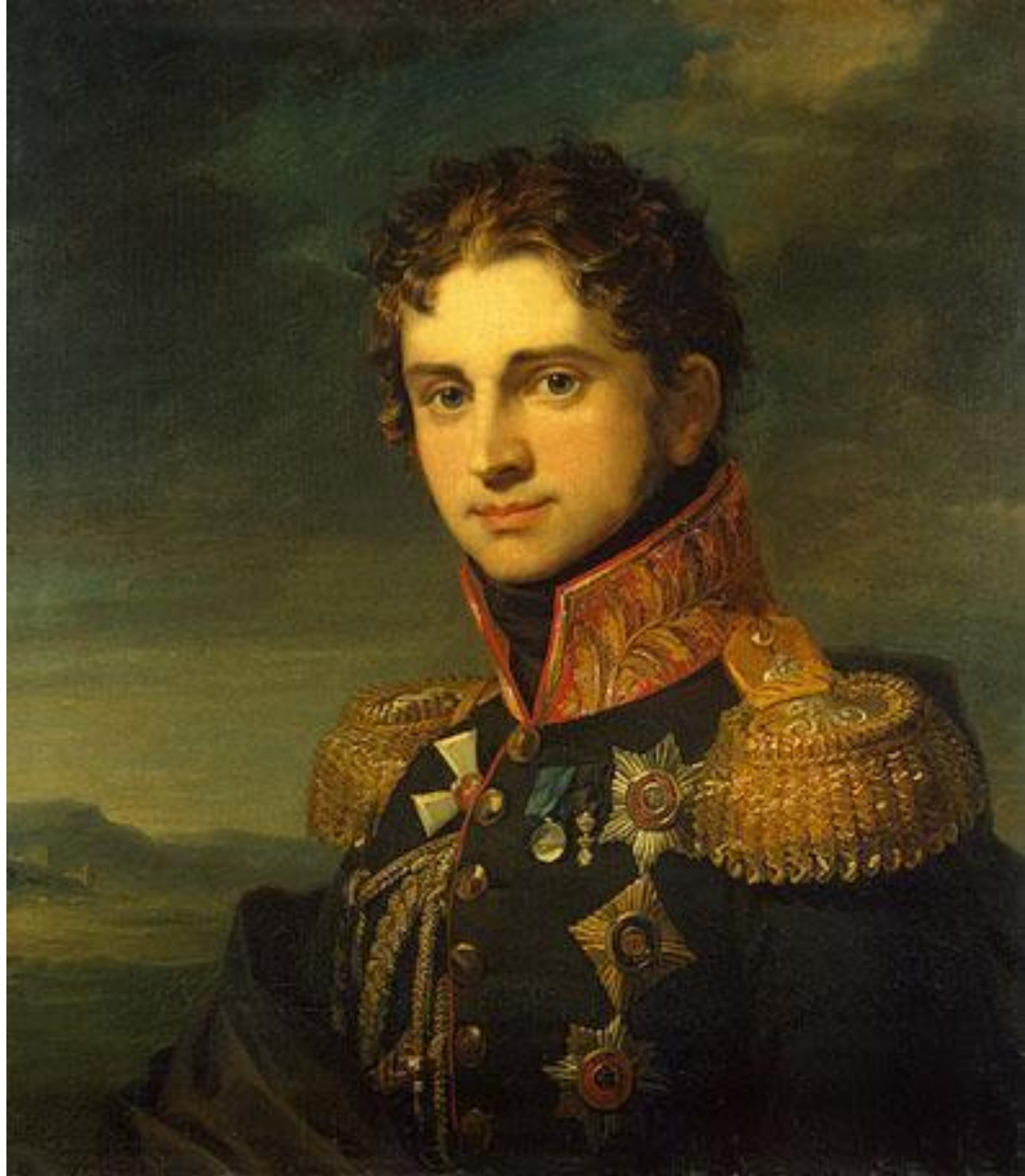
Автор неизвестен. Портрет из Военной галереи Зимнего дворца. 1819 - 1825