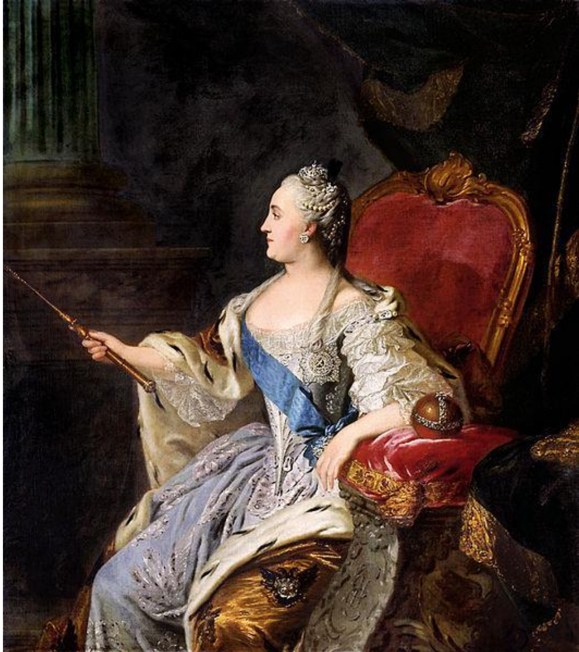
Ф. С. Рокотов. Портрет Екатерины II, 1763

Хотела сделать императором внука, а не сына