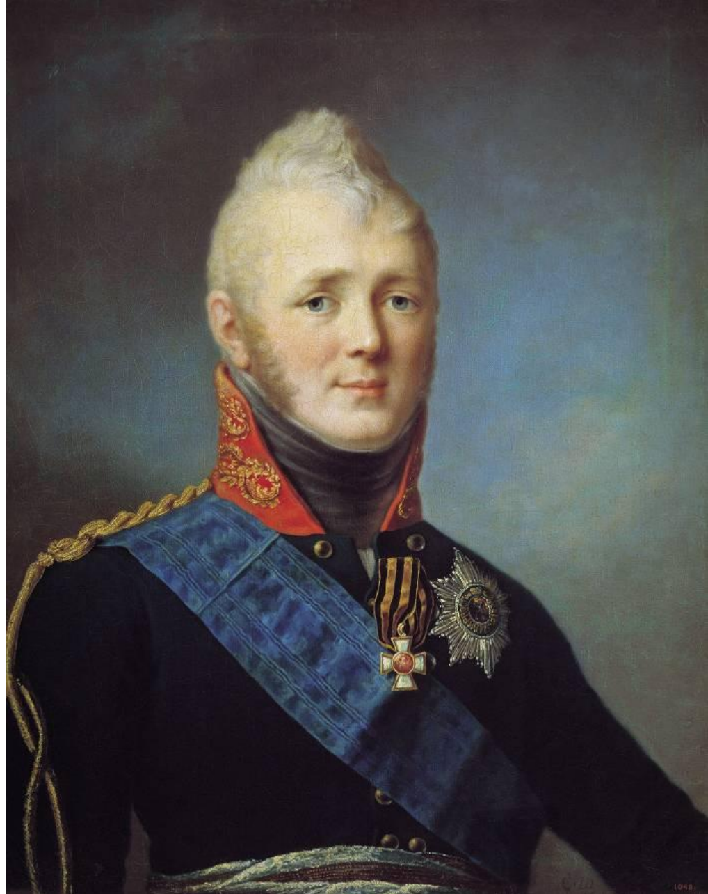
Щукин С.С. Портрет Александра I. начало 1800 - х

Умело лавировал между ними, руководствуясь идеями обоих.