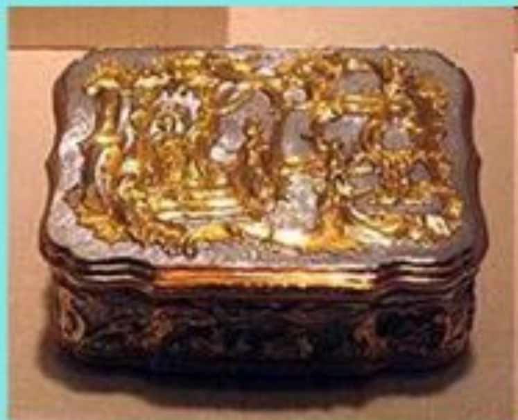
Золотая табакерка 18 века.

По одной версии, Павел был убит Н.Зубовым (зять Суворова), который ударил его массивной золотой табакеркой.