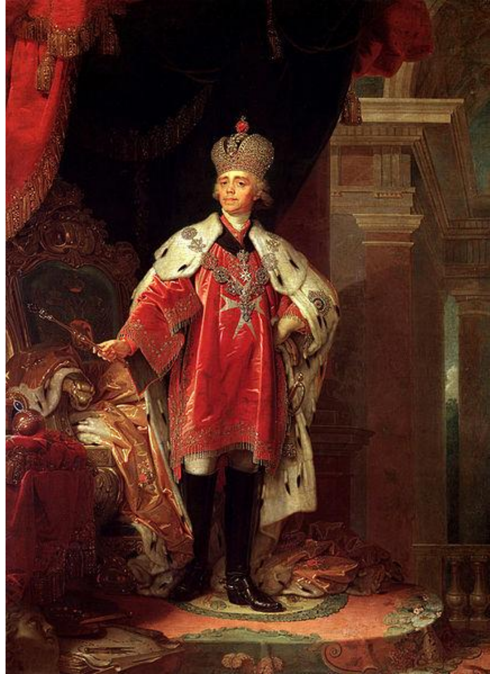
Боровиковский В. Л. Портрет Павла I. около 1800 г

С детства он разрывался между отцом и бабушкой и поэтому в нем сформировались такие черты как лицемерие и двуличность.