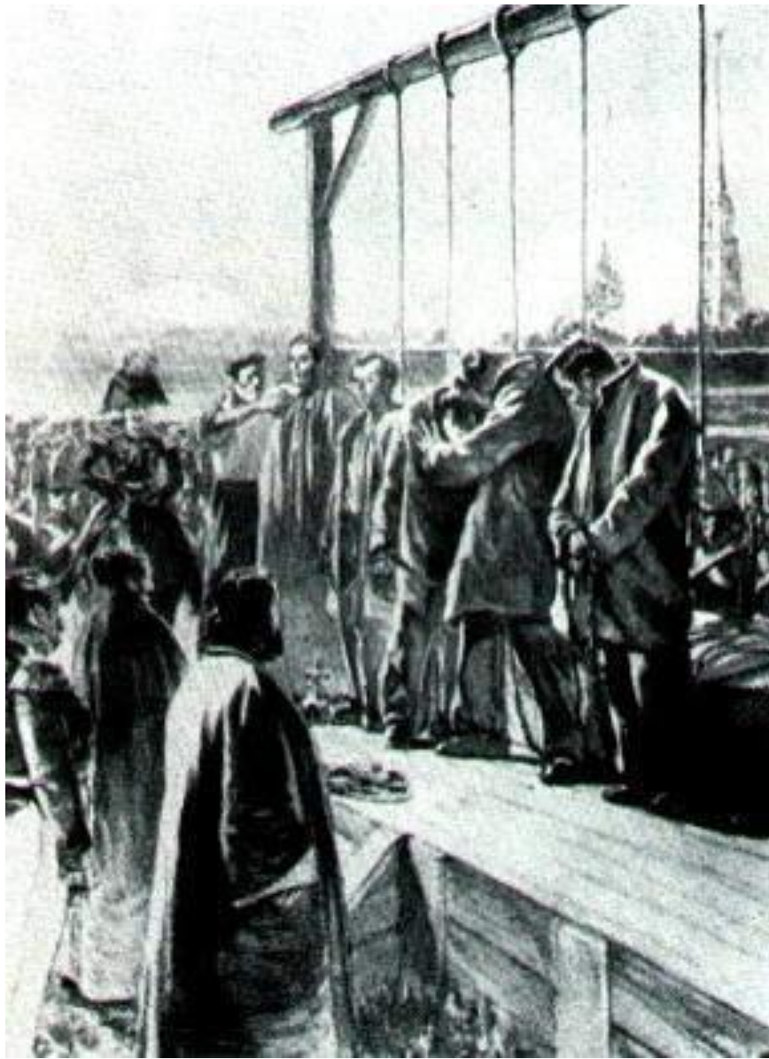
Д.Кардовский Казнь декабристов

10 (22) июля 1826 Николай I смягчил приговор для декабристов, сохранив смертную казнь через повешение только для главных «зачинщиков»: