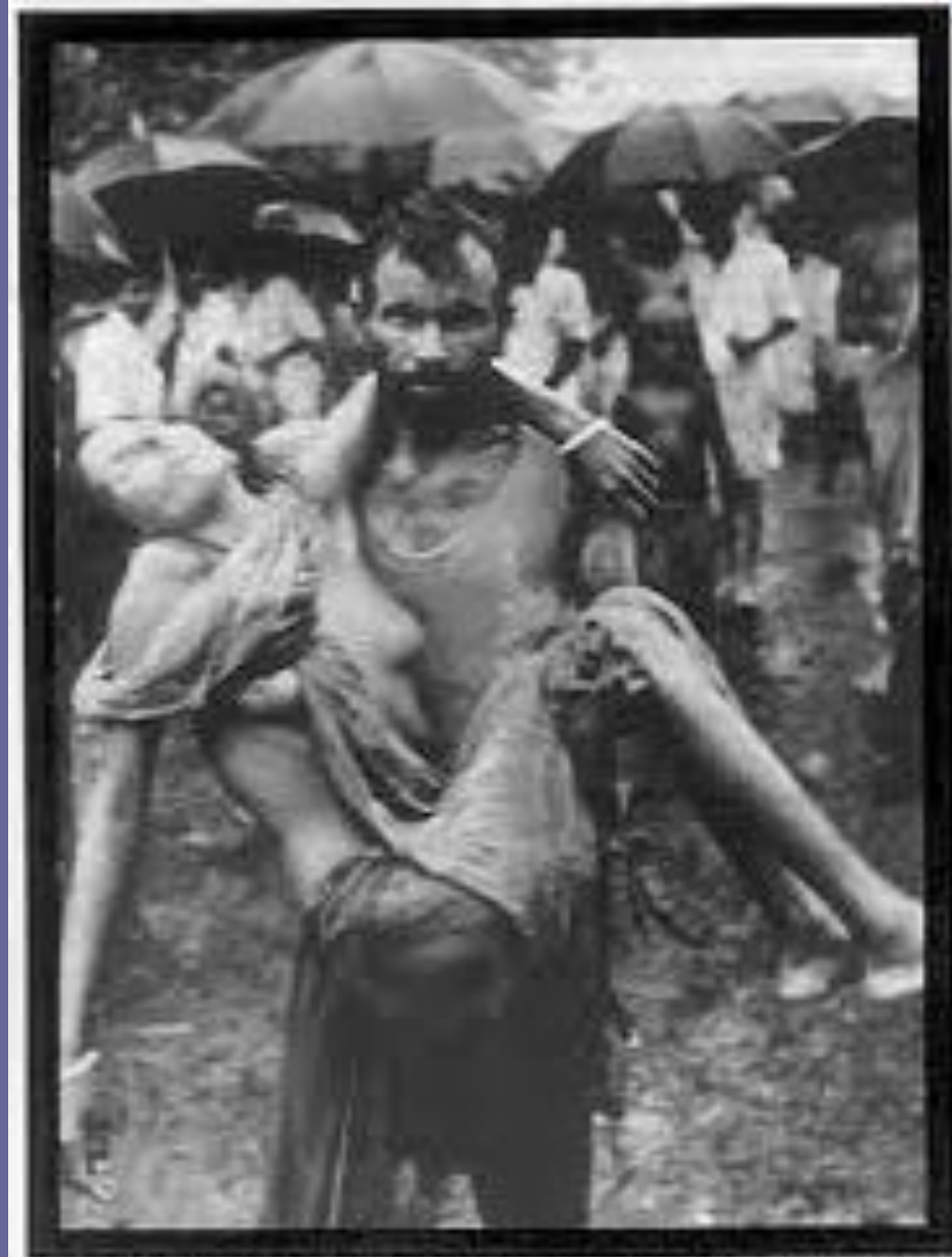
The disease of cholera in Bangladesh in the early 1900's. Cases were controlled and prevented by the paper filter used etc.

Заболевание возникает остро. Начальным периодом холеры является понос — диарея, ему могут предшествовать легкие боли в животе. Затем появляется обильный жидкий стул калового характера. Испражнения учащаются и с каждым разом становятся все обильнее. Акт дефекации не сопровождается болезненностью, но после каждого испражнения больной чувствует нарастающую слабость. Температура тела нормальная или субфебрильная. Период диареи продолжается от нескольких часов до полутора суток.