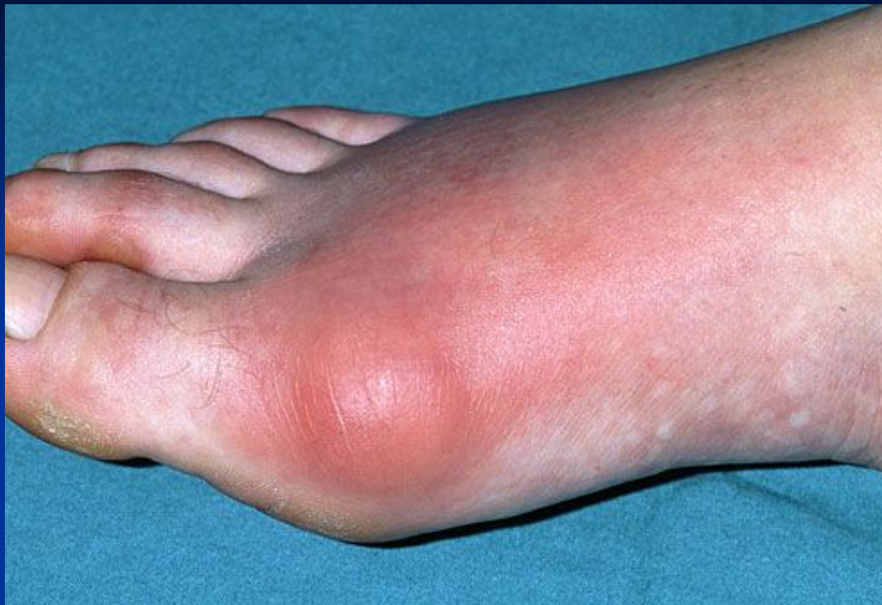
Острый подагрический артрит