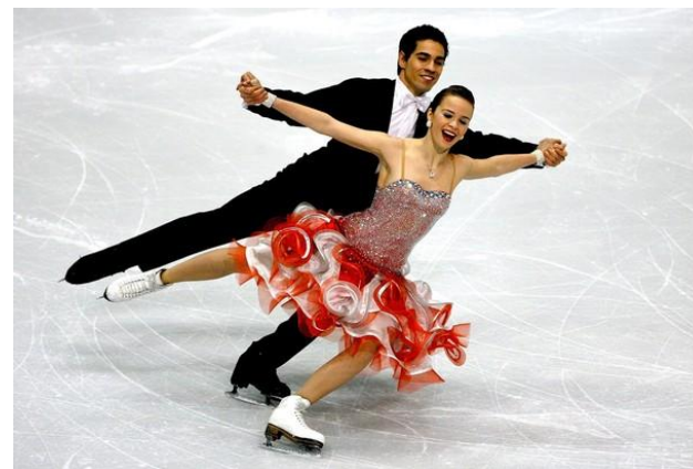
Фигурное катание - фигуристы