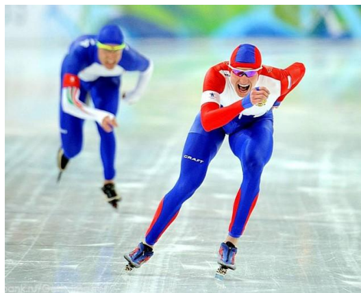
Бег на коньках - конькобежцы