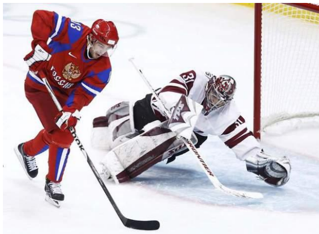
Хоккей - ХОККЕИСТЫ