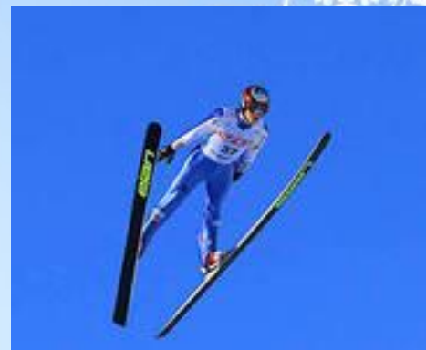
Прыжки с трамплина