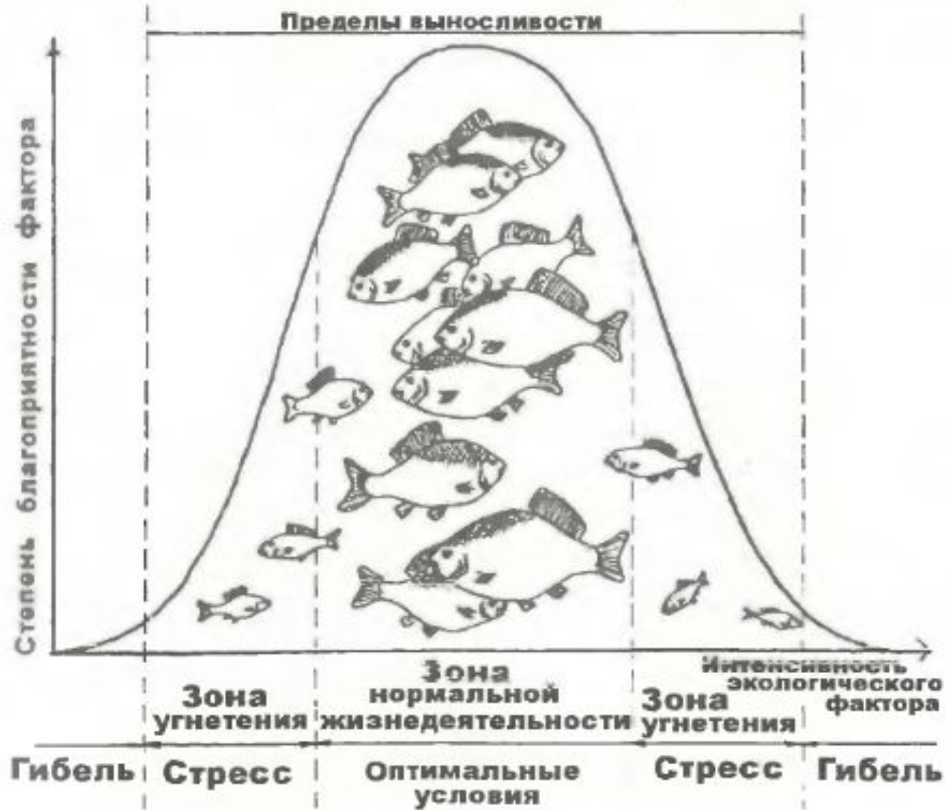
Зависимость результата действия экологического фактора от его интенсивности