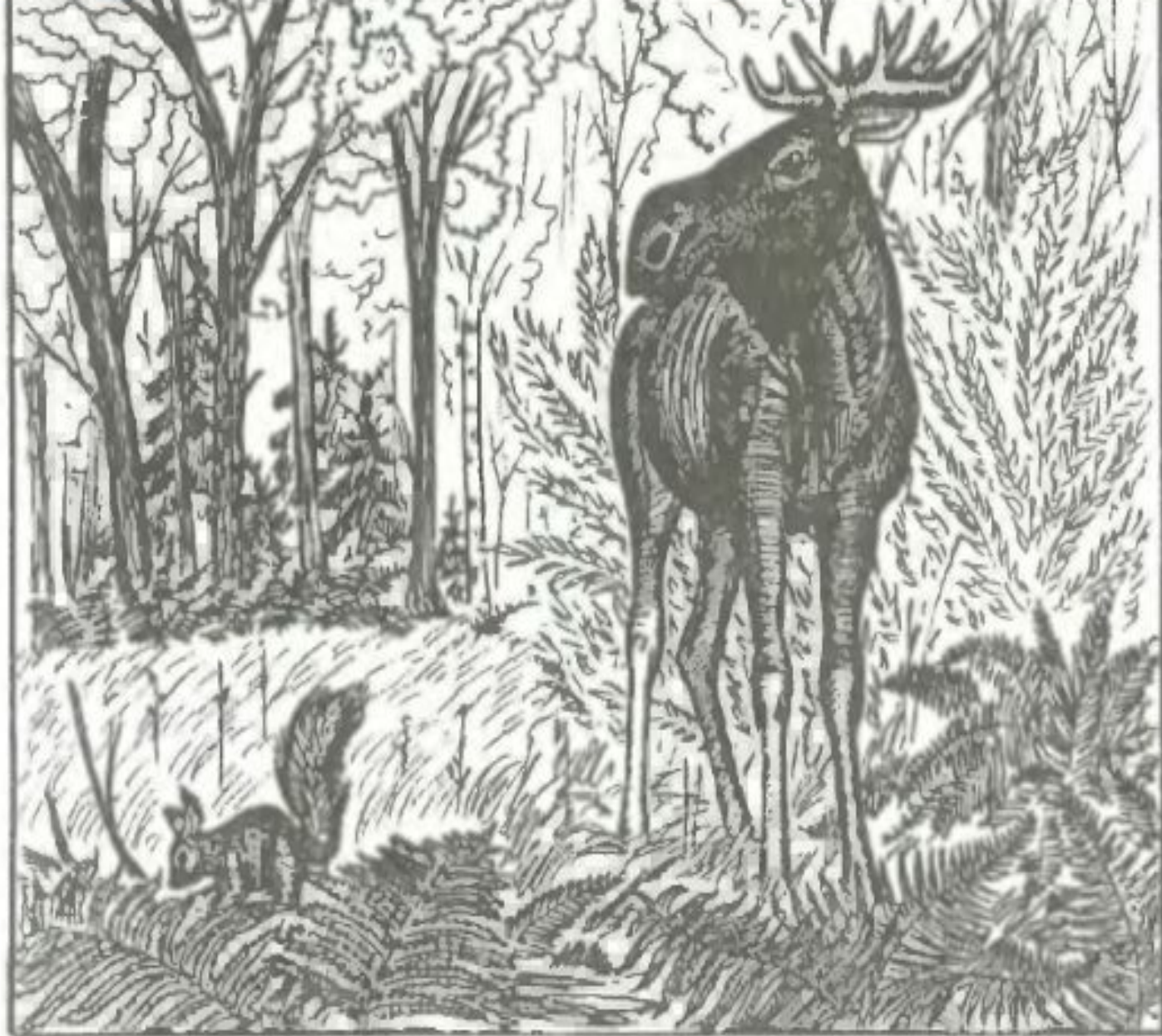
Экологическая система леса