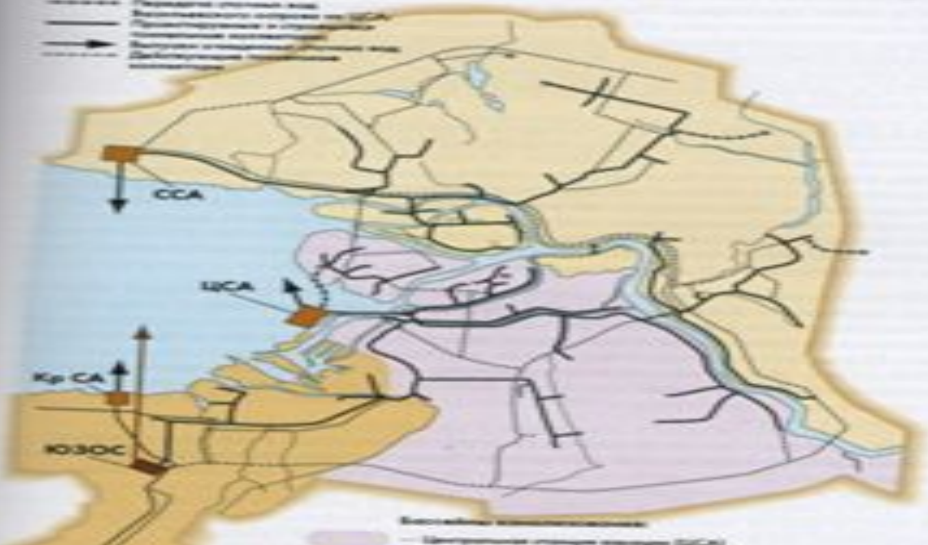
Генеральная схема канализации Ленинграда –1966-1971 гг.