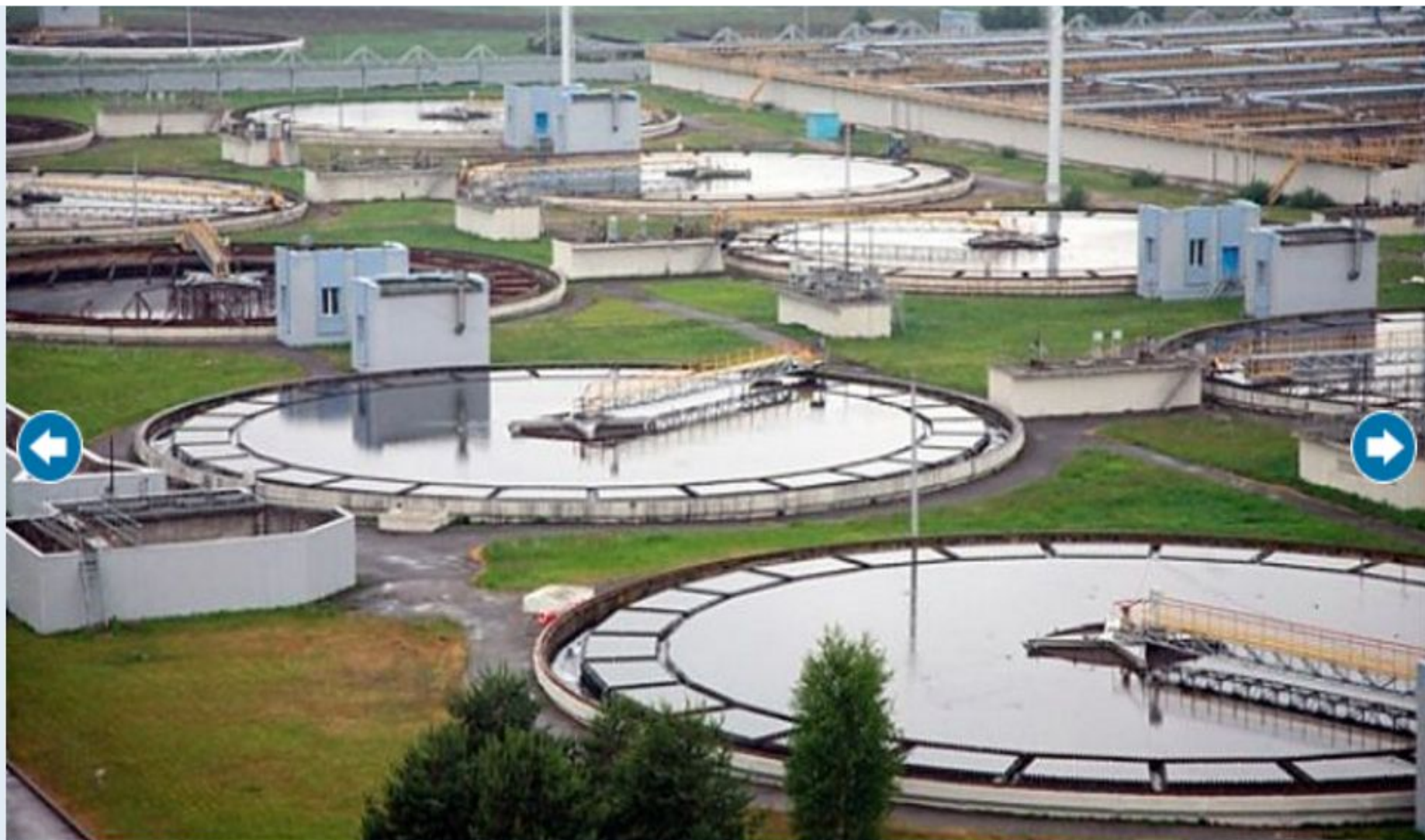
Панорама канализационных очистных сооружений