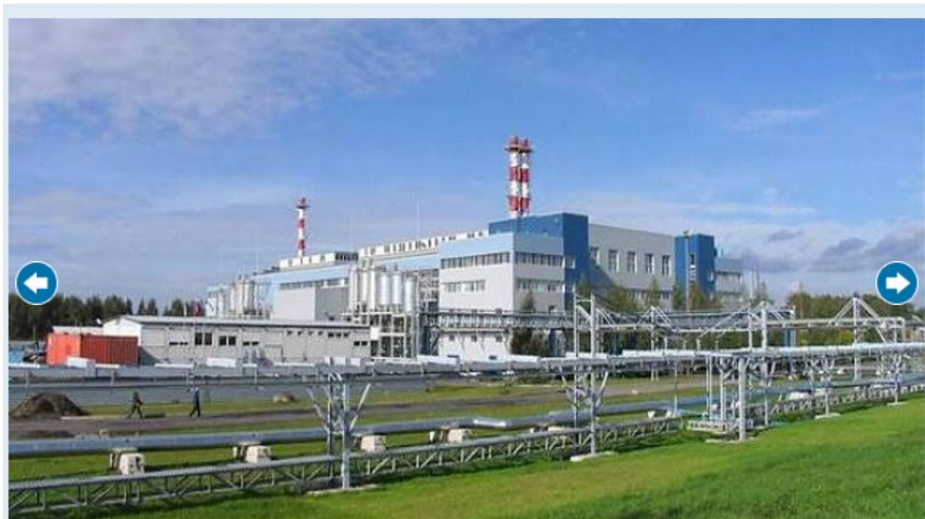
Завод по сжиганию осадка на ССА