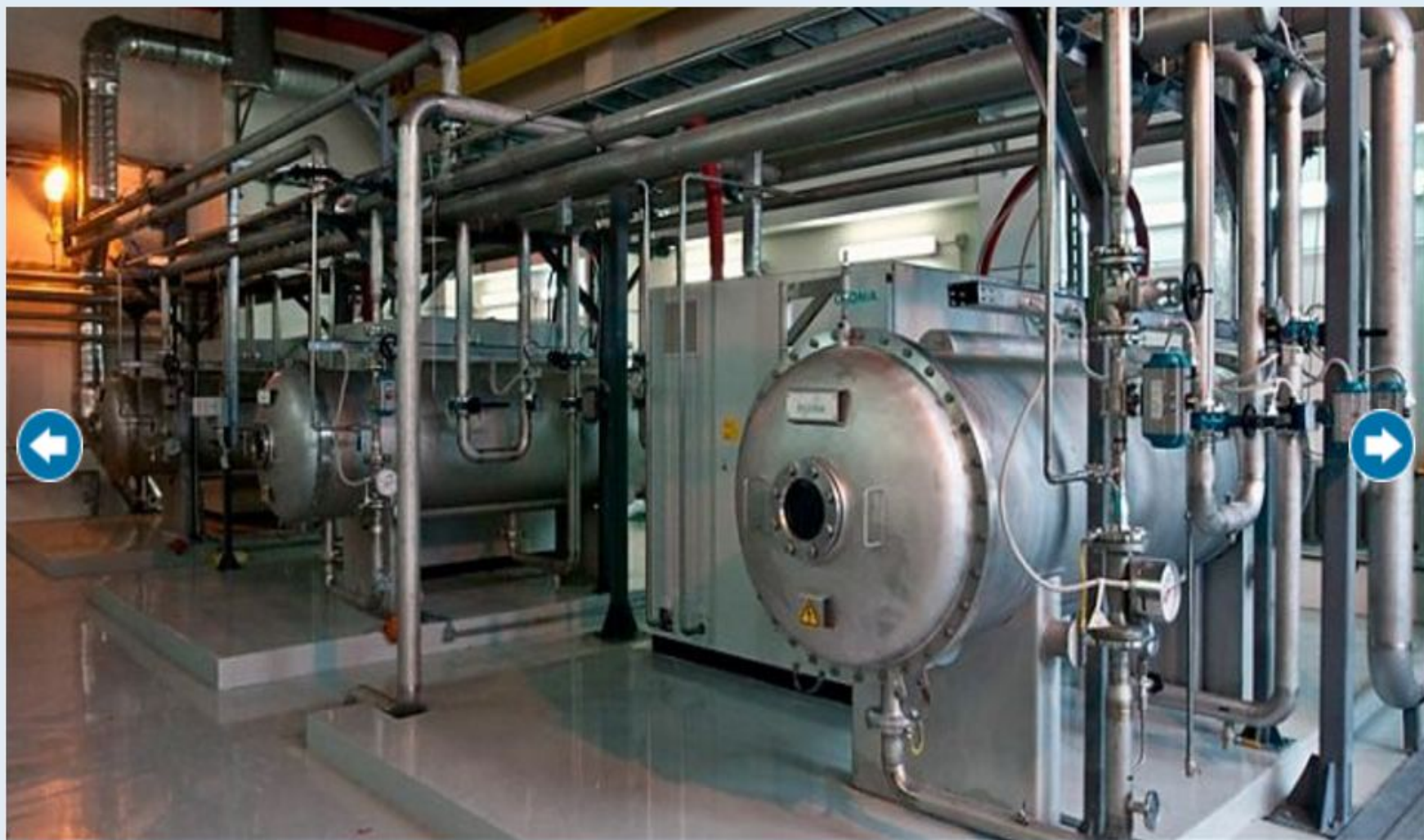
Озонаторная на блоке К-6