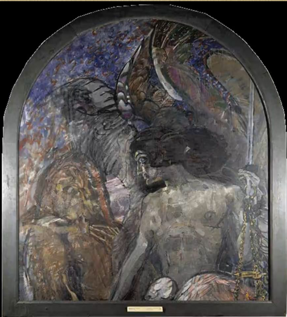
Small, illegible text label at the bottom center of the painting.