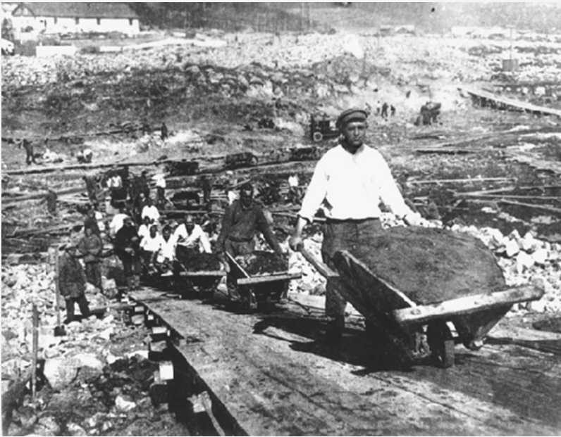
Умови праці ГУЛАГу