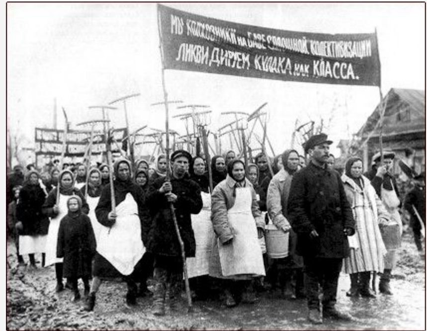
Маніфест за винищення класу "кулаків"