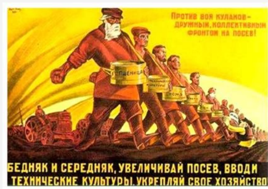
Плакат часів радянзації