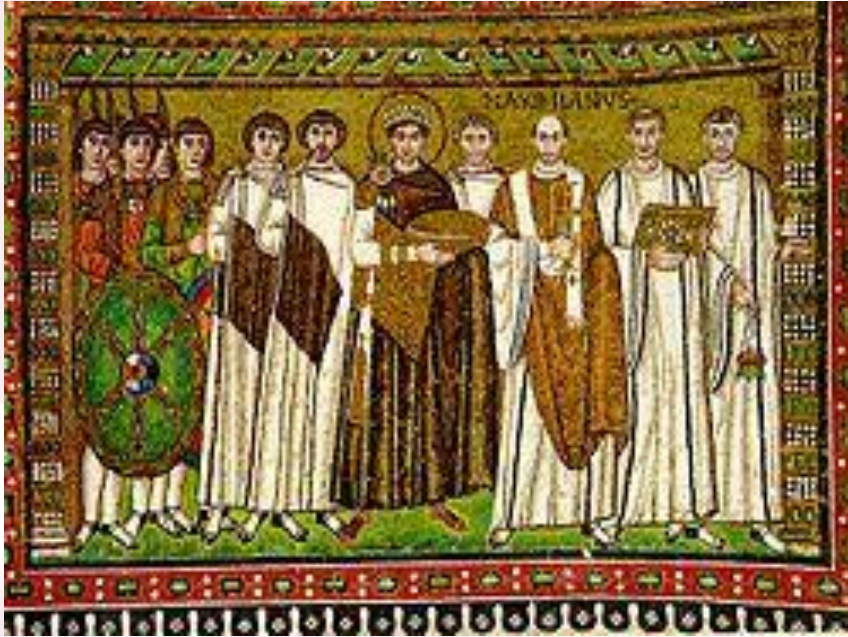
Юстиниан I. Мозаика церкви Сан-Витале в Равенне