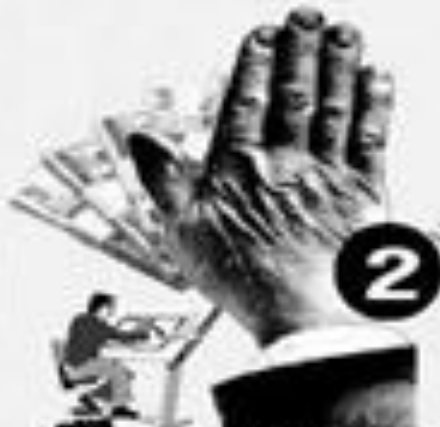
поступление в вуз