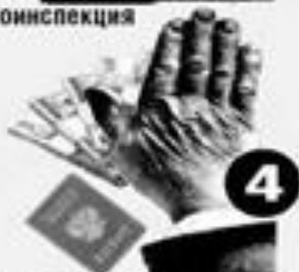
регистрация по месту жительства, получение паспорта