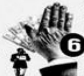
устройство на работу

За последние пять лет более чем в 10 раз возросли размеры деловых взяток - с 10 тыс. долл. в 2001 году до 135 тыс. долл. в 2005 году.