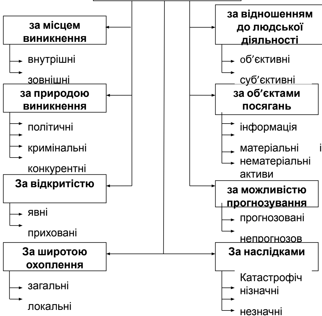
Класифікація загроз економічній безпеці підприємництва