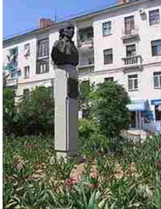
Памятник А. В. Суворову в Севастополе, 1983