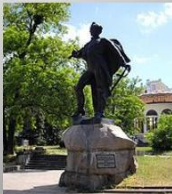
Берег реки Салгирь