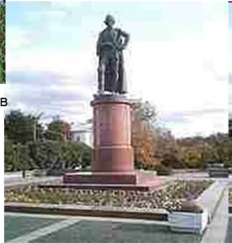
Памятник Суворову в Москве. Скульптор О. К. Комов