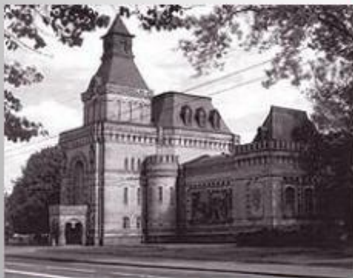
Мемориальный музей в Санкт-Петербурге