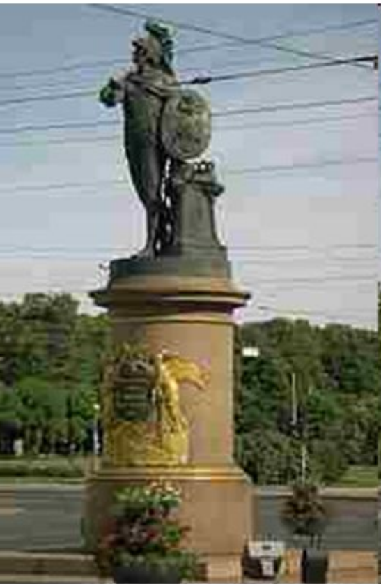
Памятник Суворову в Санкт-Петербурге, Михаил Козловский,