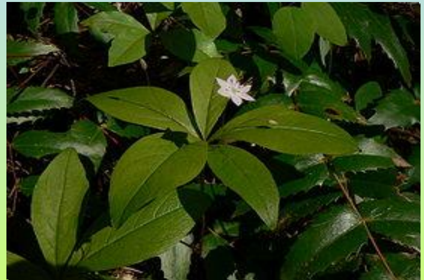
Седмичник (сырые леса)