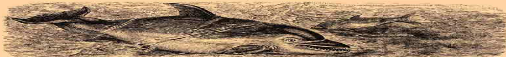
2. Обыкновенный дельфинъ (Delphinus delphis).