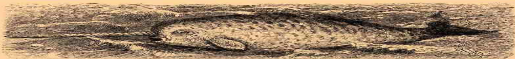
1. Нарвалъ, морской единорогъ (Monodon monoceros).