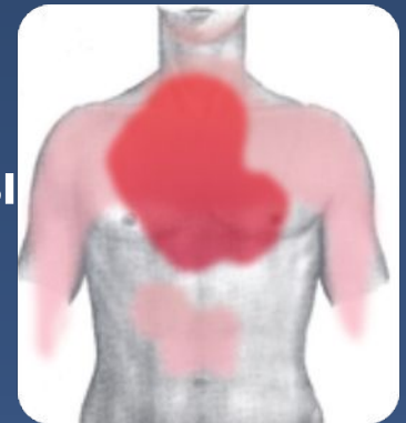
Болевые зоны при инфаркте миокарда

Кроме того могут быть следующие симптомы