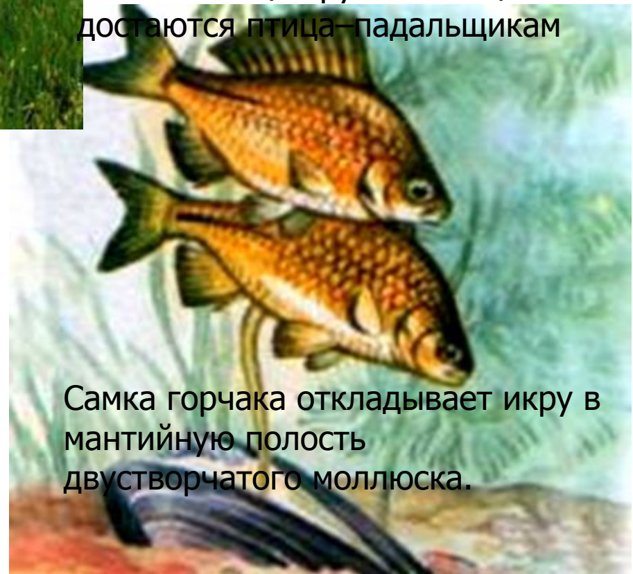
Самка горчача откладывает икру в мантийную полость двустворчатого моллюска.

*( При таких взаимодействиях один из организмов улучшает свое положение, а другой не испытывает значимых изменений).