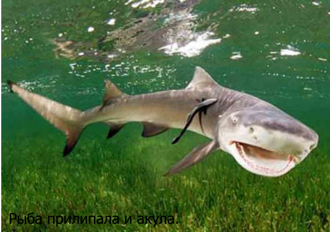
Рыба прилипала и акула.