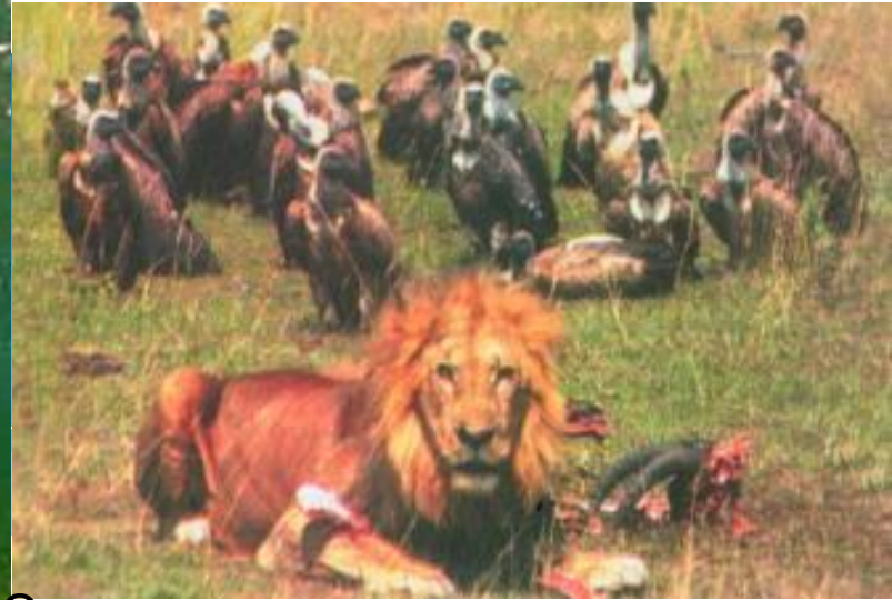
Остатки пищи крупных хищников достаются птица-падальщикам

Что объединяет такие формы комменсализма как нахлебничество и квартирантство?