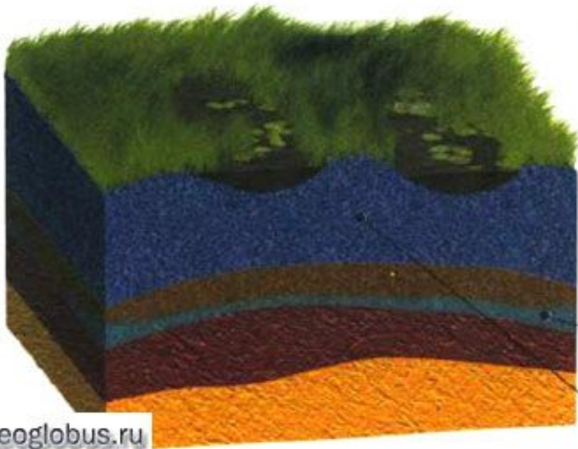
Верховое болото на водоразделе