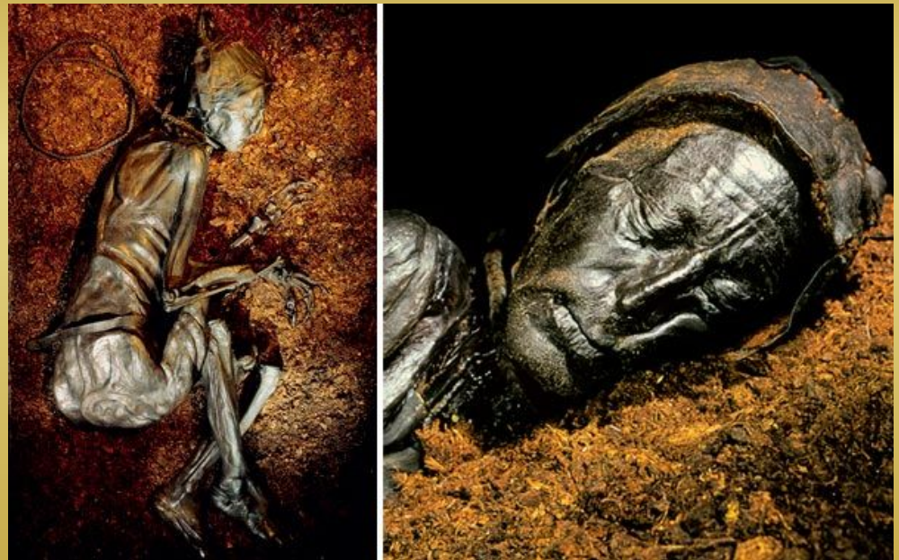
Человек из Толлунда

Кислота в болоте + низкие температуры воды + недостаток кислорода оказывает дубильное воздействие на кожу (темно-коричневый цвет найденных тел). Отсутствие кислорода + антибактериальные и консервирующие свойства сфагнома = тела прекрасно сохраняются.