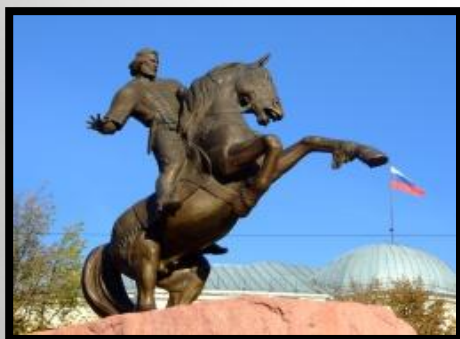
Памятник Евпатию Коловрату