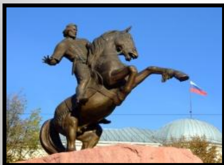
Обл. художественный музей