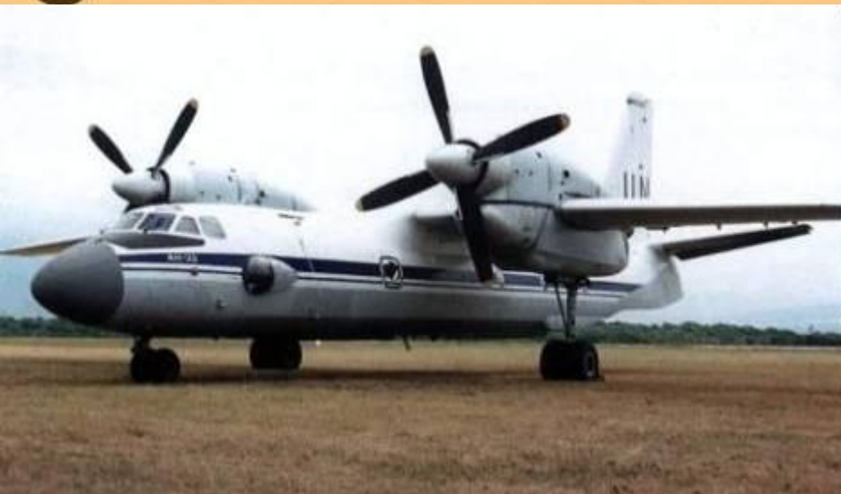
Ан-32. ВВС Индии