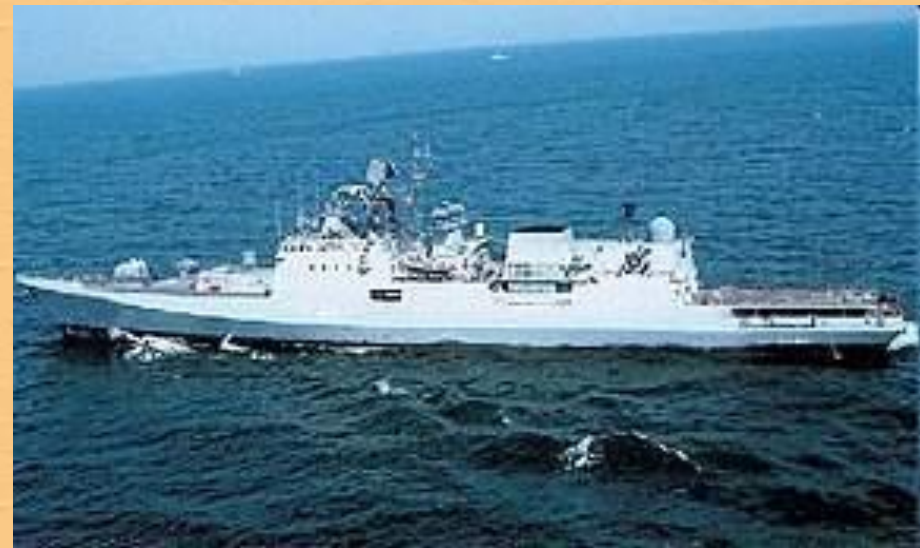
Индийский военный корабль "Табар"