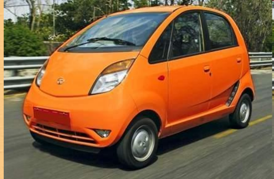
Индийский автомобиль «Tata Nano»

Также развит авиационный, автомобильный, морской и речной транспорт.