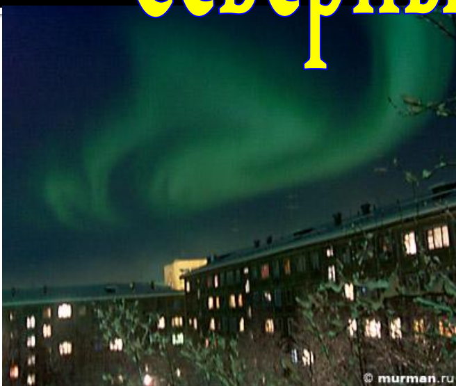
Полярная ночь. Северное сияние