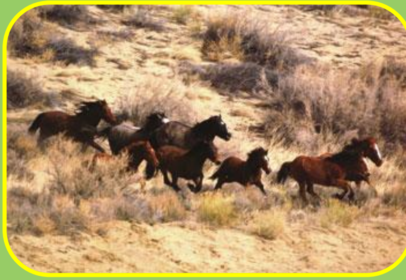
Прерия-степь, поросшая высокими травами.