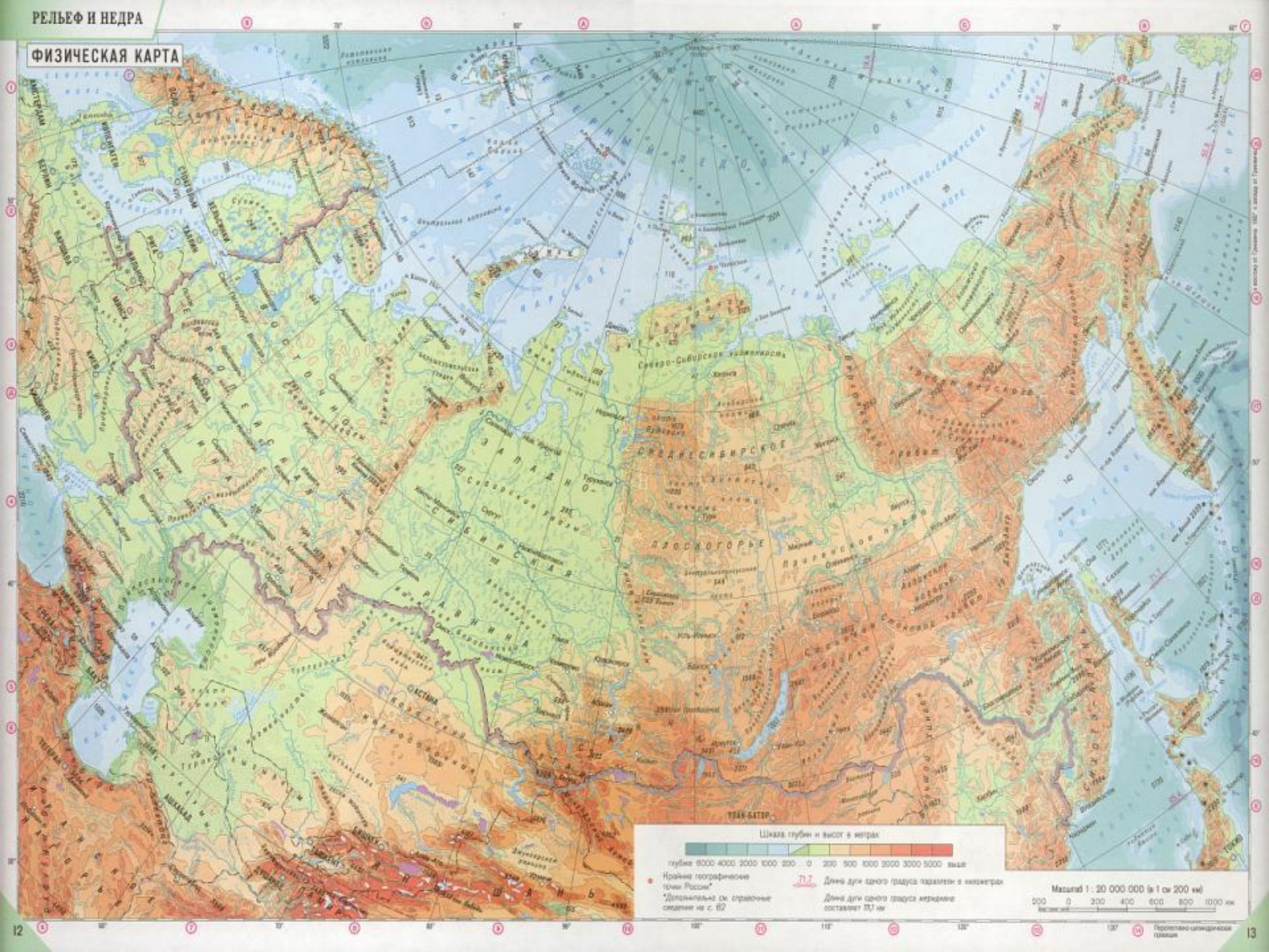
Шкала глубин и высот в метрах

глубина 8000 4000 2000 1000 200 0 200 500 1000 2000 3000 5000 выше