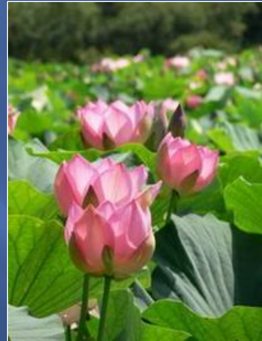
Лотосы в дельте