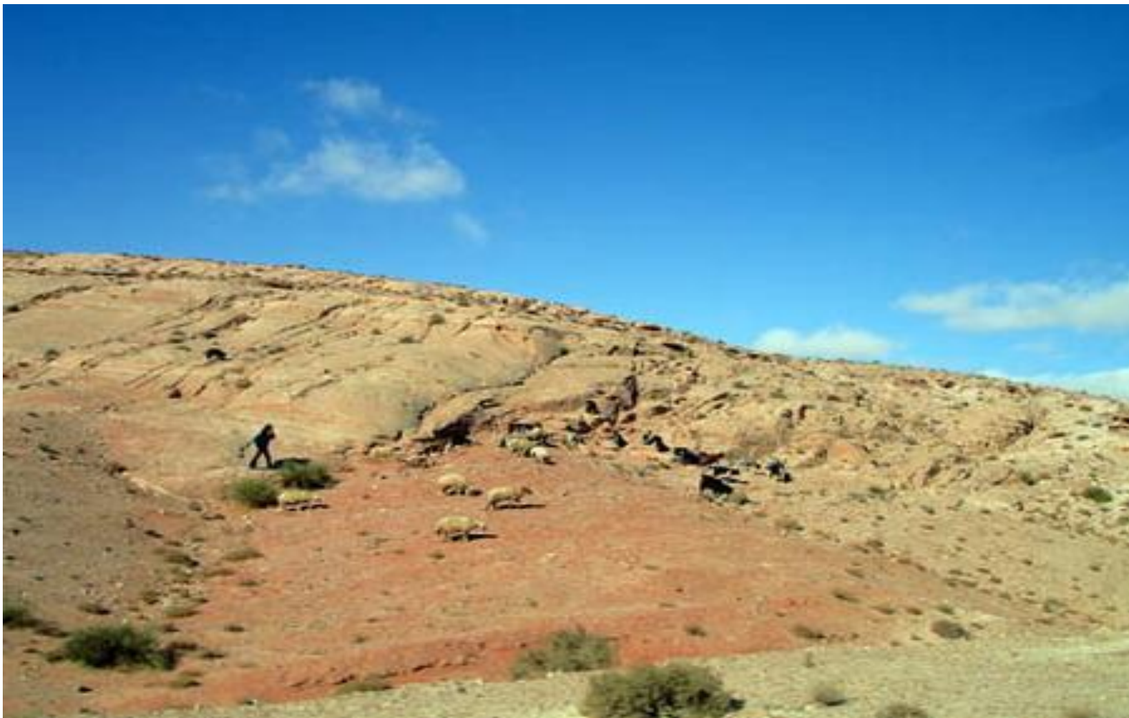
Пустыня Вади Рам