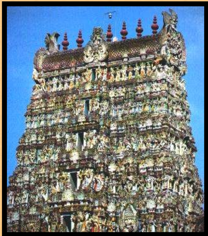
Ворота Райя в Мадураи.

Архитектура страны отличалась удивительным разнообразием.