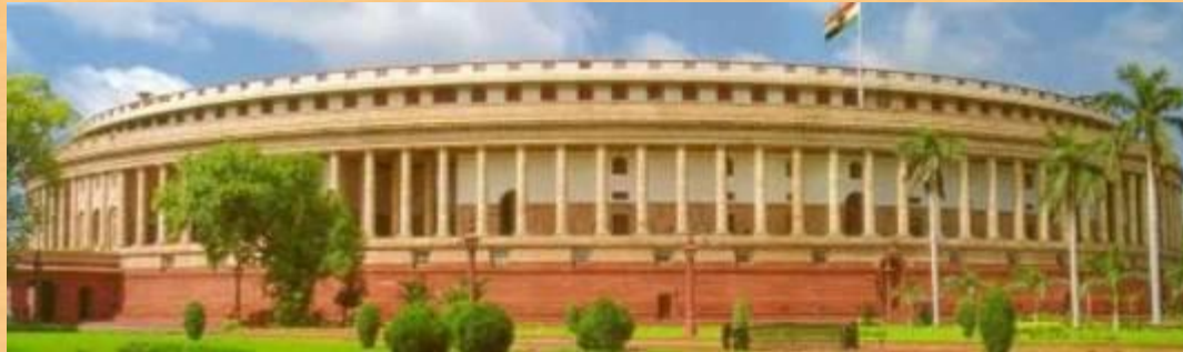
Здание парламента Индии

Минимальный возраст претендентов на место в верхней палате установлен в 30 лет.